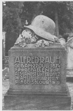
Gefallenengrab auf dem neuen israelitischen Friedhof

Exkursionsblätter zur Geschichte und Kultur der Juden in Bayern