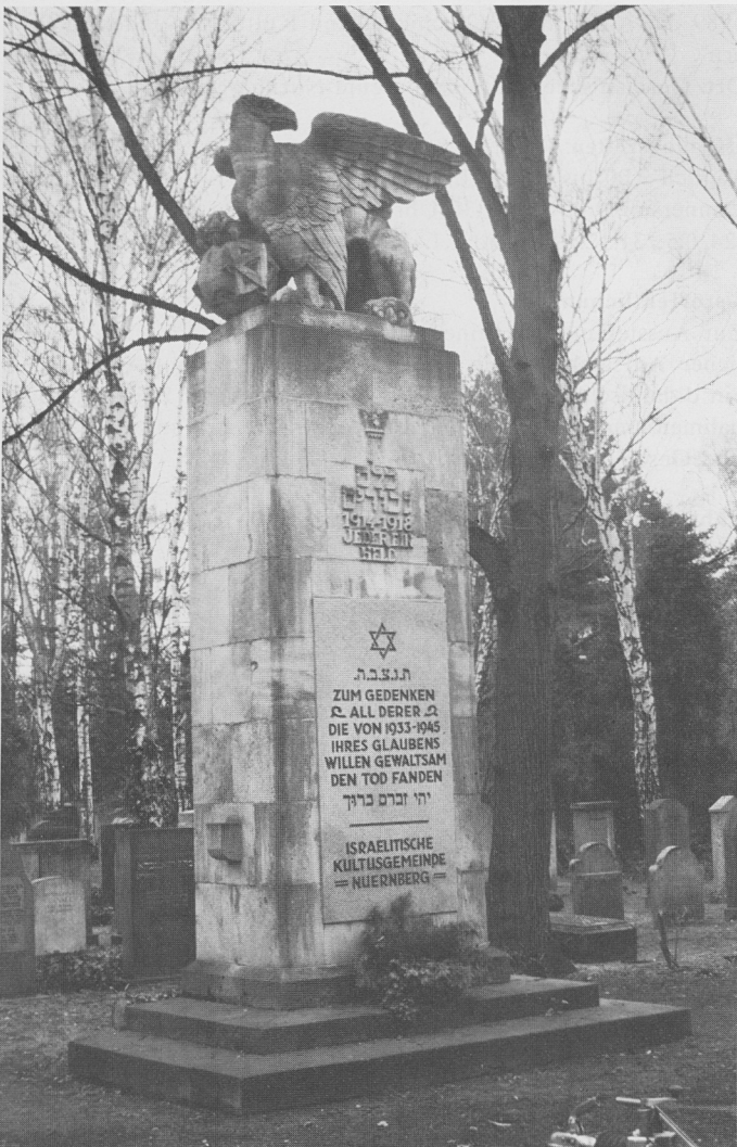
Ehrenmal auf dem neuen israelitischen Friedhof

Wegstrecke: Vom Ende der Bärenschanzstraße nach rechts: Fürther Straße - rechts: Maximilianstraße - Bus 38 bis "Krematorium" - zu Fuß auf der Schnieglinger Straße Richtung Westen bis kurz vor der Bahnunterführung