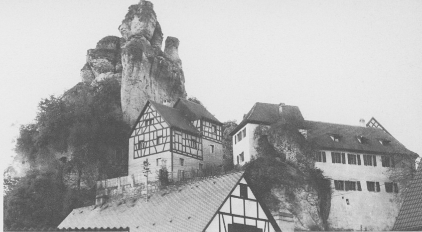
Tüchersfeld: der ehemalige Judenhof.

Exkursionsblätter zur Geschichte und Kultur der Juden in Bayern