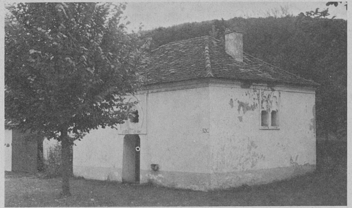
Mikwe in Mönchsdeggingen

Exkursionsblätter Zur Geschichte und Kultur der Juden in Bayern