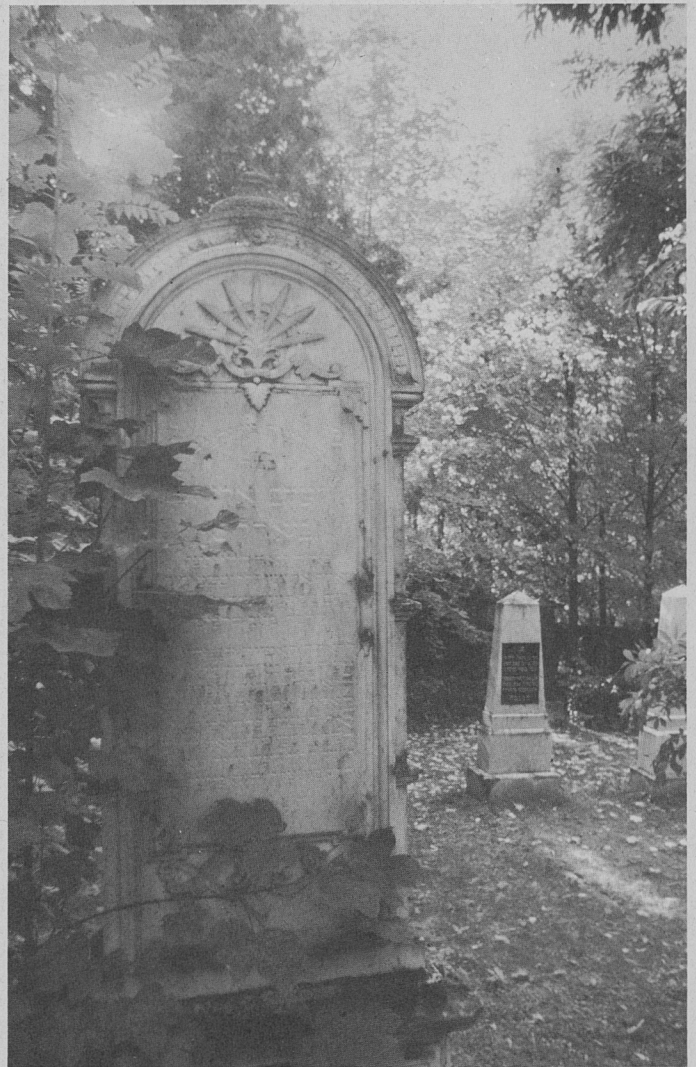
Grabmal in Nördlingen