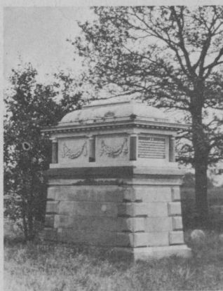
Grabmonument des Michael Reese

Exkursionsblätter zur Geschichte und Kultur der Juden in Bayern