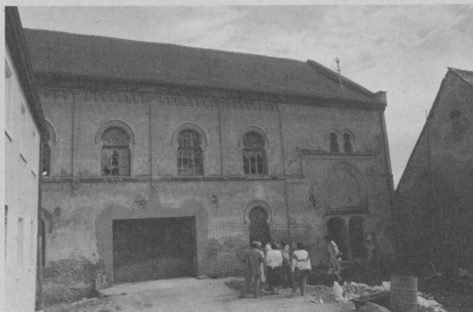
Synagogengebäude in Hainsfarth

Der Bedeutung der großen jüdischen Gemeinde von Hainsfarth im 19. Jahrhundert entsprach es, daß sie 1822 eine eigene Elementarschule erhielt. Sie löste die vorher vorhandene Talmudschule ab, in der seit 1727 ein Vorsänger und Schulmeister für den Talmudunterricht gewirkt hatte. Die jüdische Volksschule blieb bis 1920 bestehen. Danach besuchten die jüdischen Kinder die katholische Volksschule ihres Heimatortes.