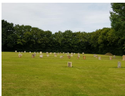
Jüdischer Friedhof Wallerstein.