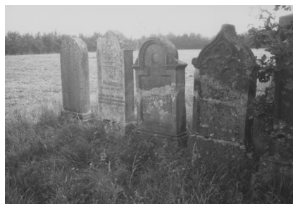
Jüdischer Friedhof Wallerstein.