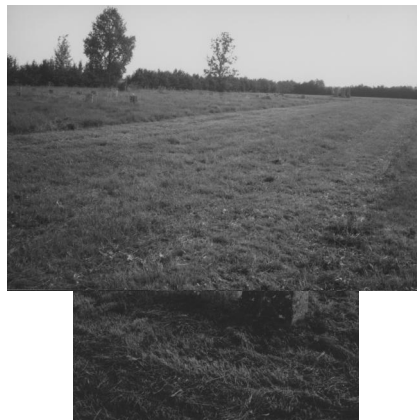
Jüdischer Friedhof Wallerstein.