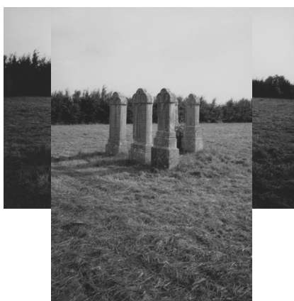
Grabsteine für fünf Rabbiner auf dem jüdischen Friedhof Wallerstein.