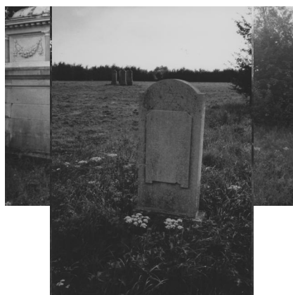
Jüdischer Friedhof Wallerstein.