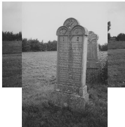
Jüdischer Friedhof Wallerstein.