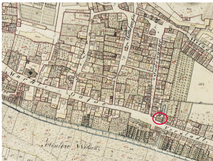
Wallerstein, Uraufnahme 1808-1864 (Ausschnitt). Die Synagoge (Haus 238) am Standort des abgerissenen "Juden-" oder Markttors ist rot markiert.

Bis ins letzte Viertel des 17. Jahrhunderts gibt es keinerlei Informationen über ein jüdisches Gotteshaus oder einen Betsaal in Wallerstein. Erst unter dem Jahr 1679 wird berichtet, dass die „fünf Bücher Moses“ feierlich in die Synagoge des Ortes gebracht wurden. Dabei handelte es sich wohl um einen kleinen Betsaal im Turm des sog. "Judenthors" im Südosten der Siedlung (heute Hauptstraße 61, 1804 abgerissen), nahe der "Judengasse" (heute Felsengasse). Das Gebäude wurde offensichtlich von der Kultusgemeinde verwaltet, denn Ausbesserungen, die 1712 an diesem Tor anfielen, mussten die Gemeinschaft alleine finanzieren.