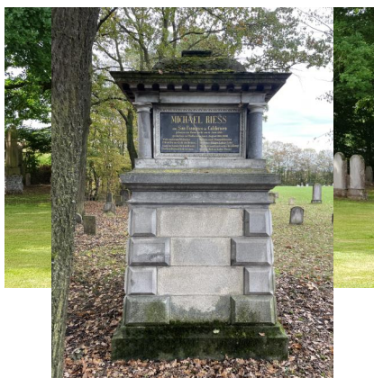
Jüdischer Friedhof Wallerstein, 2020.