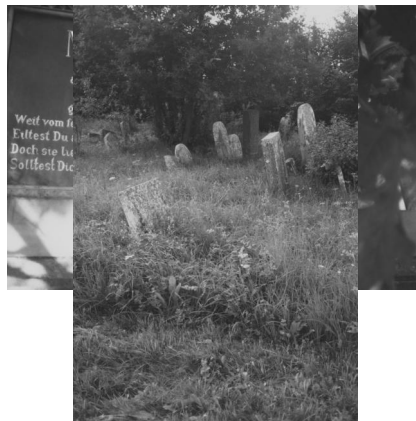
Jüdischer Friedhof Wallerstein.