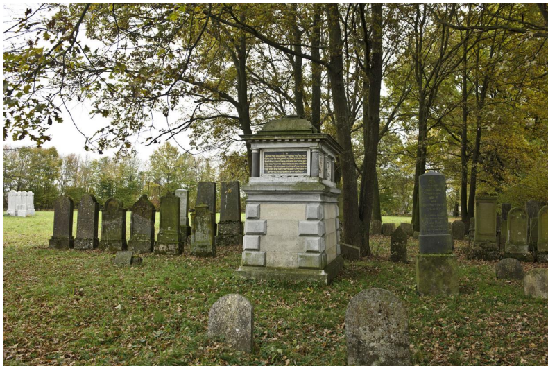
Jüdischer Friedhof Wallerstein.

Der jüdische Friedhof Wallerstein liegt etwa einen Kilometer östlich des Ortes inmitten von Wiesen und Feldern. Er hat eine Fläche von über 10000 qm und ist um 1510 angelegt worden. Ursprünglich waren 900 Grabsteine vorhanden.