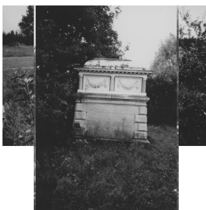
Jüdischer Friedhof Wallerstein.