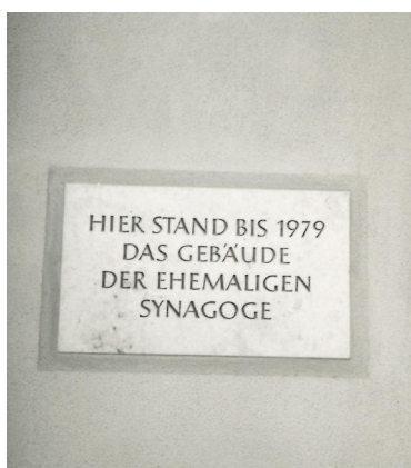
Gedenktafel am Nachfolgebau des 1979 abgebrochenen Synagogengebäudes (Aufnahme 1987).