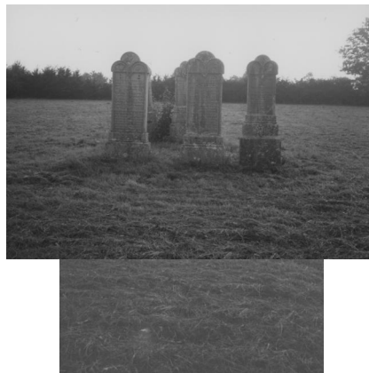
Jüdischer Friedhof Wallerstein.