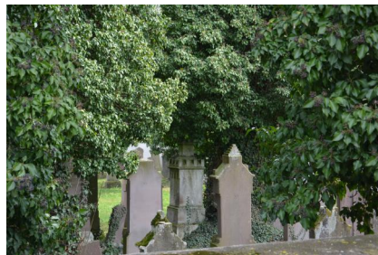
Fellheim, jüdischer Friedhof mit Umfassungsmauer und Infotafel (Aufnahme 2021).