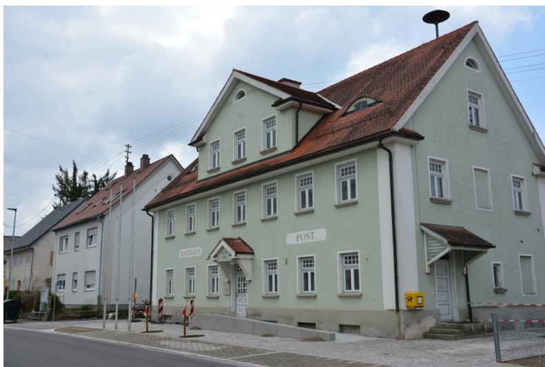
Fellheim, Memminger Straße 44, Rathaus und Postamt, ehem. jüdische Schule mit Gedenktafel (Aufnahme 2021).