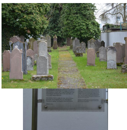
Fellheim, jüdischer Friedhof mit Umfassungsmauer und Infotafel (Aufnahme 2021).