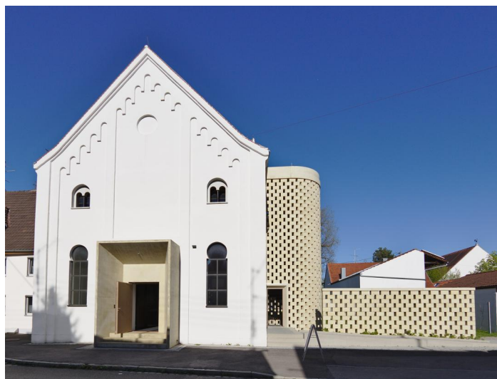
Die ehemalige Synagoge Fellheim 2017.

In den ersten Jahren feierte die jüdische Gemeinde Fellheim ihre Gottesdienste in einem Privathaus. Freiherr Johann Christoph Reichlin plante 1712 für seine Schützlinge eine Synagoge zu errichten, doch der damalige Augsburger Bischof vereitelte diesen Plan. Erst 1786 konnte dieses Vorhaben verwirklicht werden. Maurermeister Thaddäus Rüeff aus Gutenzell errichtete an der Landstraße (Haus Nr. 58, heute: Memminger Str. 17) einen ansehnlichen dreistöckigen Barockbau mit halbkreisförmiger Vorhalle und einem angebautem Treppenhaus, das zur Frauenempore führte.