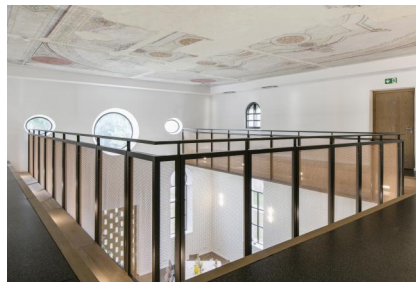
Innenansicht der ehemaligen Synagoge Fellheim.