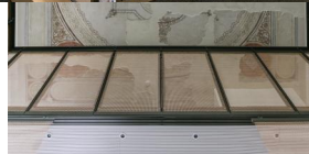
Innenansicht der ehemaligen Synagoge Fellheim.