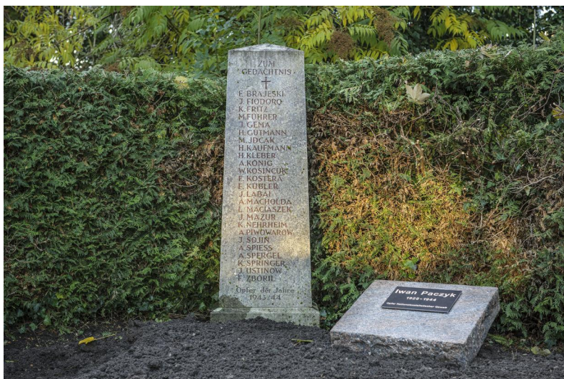
KZ-Friedhof und Gedenkstätte Lindau

Auf dem städtischen Friedhof befindet sich ein Massengrab, über dem sich ein kleiner Obelisk inmitten von Bepflanzung erhebt. Unter einem Kreuz sind die Namen der NS-Opfer aufgelistet, darunter offensichtlich auch Juden (z. B. IDCAK). Unter den Namen steht, kaum leserlich: „Opfer der Jahre 1943-45“, darüber: „Zum Gedächtnis“.