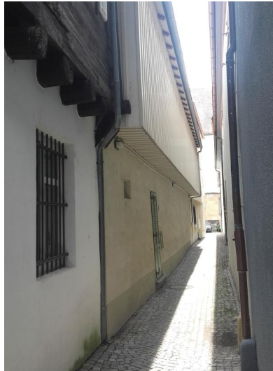
Lindau, Blick in das Mautgässle, vermuteter Standort der Synagoge bis ins 14/15. Jahrhundert (Aufnahme 2021).

Die um 1400 bereits aufgelöste jüdische Gemeinde in Lindau besaß eine Synagoge bzw. Betstube, die der Stadtchronik und lokalen Überlieferungen gemäß im heutigen Mautgässle zu verorten ist. Diese sehr schmale Gasse lag im Süden der Insel Altstadt. Nach dem Wegzug der letzten jüdischen Bewohner, sei es aus Zwang oder aus freien Stücken, wurde die Synagoge zu einem nicht näher bekannten Zeitpunkt im 14. oder erst im 15. Jahrhundert abgebrochen und an seiner Stelle ein "städtisches Gardehaus" (Wachhaus) errichtet, das inzwischen ebenfalls verschwunden ist.