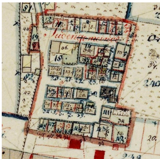
Osterberg, Uraufnahme 1808-1864 (Ausschnitt). Südlich des Ortskern wurde die in sich geschlossene "Judengemeinde" erfasst, wobei das Wort "Gemeinde" nach dem Verlust der Selbstverwaltung durchgestrichen wurde.