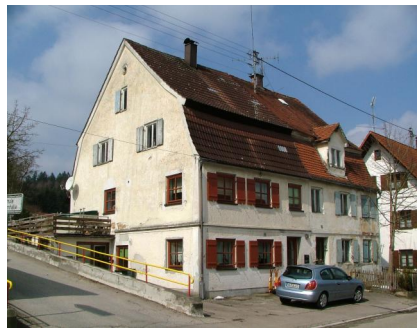
Ehemaliges jüdisches Wohnhaus, zweigeschossiges Doppelhaus mit Mansarddach, um 1800.