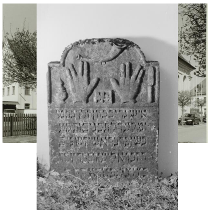
Ehemalige Synagoge Ichenhausen, 2003.