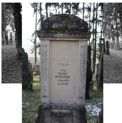
Jüdischer Friedhof Ichenhausen.

Schändungen: Anfang Mai 1929, wobei die Bretterumzäunung teilweise niedergerissen und zehn Grabsteine zerstört wurden, sowie im Gefolge des Novemberpogroms 1938, als die Täter Hunderte von Grabsteinen umwarfen und dabei viele zerbrachen.