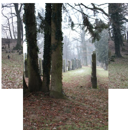
Jüdischer Friedhof Ichenhausen.