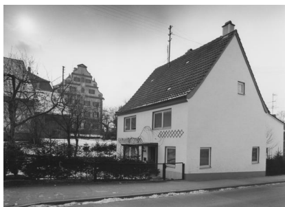
Ichenhausen, Bahnhofstraße 11, ab 1808 Ort des rituellen Bades, der Mikwe, Fotografie: 1991.

zweigeschossiger giebelständiger Satteldachbau mit Schweifgiebel, im Kern um 1763, Ende 19. Jh. im Stil der Neurenaissance überformt, Copyright Wikimedia Commons / Tilman2007