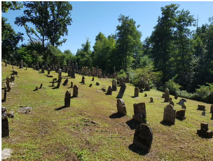
Jüdischer Friedhof Ichenhausen, 2020.

Der jüdische Friedhof liegt südlich von Ichenhausen an der Straße nach Krumbach. Er hat eine Größe von über 10000 qm und die Anlegung wurde 1567 genehmigt. Es sind etwa 1000 Grabsteine erhalten. Der Friedhof zählt zu den größten jüdischen Begräbnisstätten in Bayern.