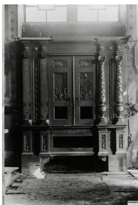
Die Synagoge von Ichenhausen: Portal, Fotografie, um 1950.