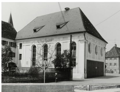
Synagoge Ichenhausen, um 1940.