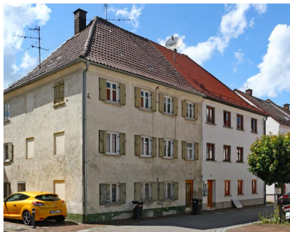
Ehemaliges jüdisches Wohnhaus, Hintere Ostergasse 6.8, dreigeschossiges Doppelhaus mit

drei Juden: Max Einstein, Hermann Reichenberger, Karl Neuberger (Torwart). Haus der Bayerischen Geschichte, jl-018.01.