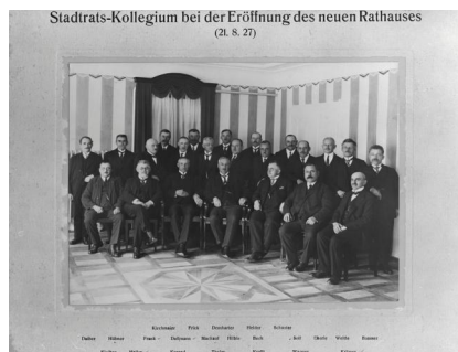
Der Ichenhausener Stadtrat anlässlich der Eröffnung des neuen Rathauses 1927 mit den jüdischen Stadträten