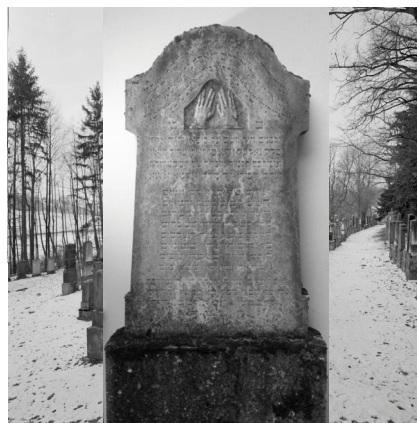
Der Ichenhausener jüdische Friedhof nach der Verwüstung am 10. November 1938. Insgesamt wurden 321 Grabsteine umgeworfen, Juden geschlagen und gedemütigt. Mindestens 28 Männer wurden in das KZ Dachau verschleppt.