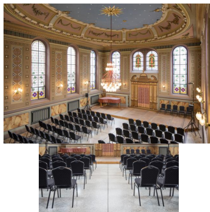
Innenansicht der ehemaligen Synagoge Ichenhausen.