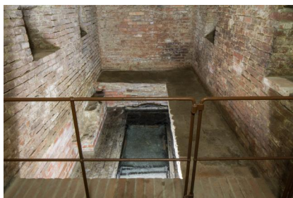
Eingang zur Mikwe im Synagogengebäude Ichenhausen.

Walmdach, 1803.