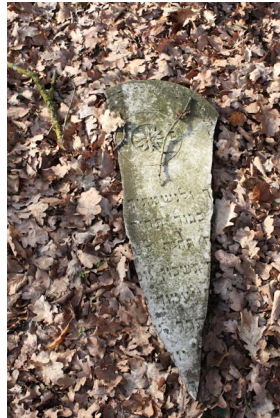
Jüdischer Friedhof Ichenhausen.