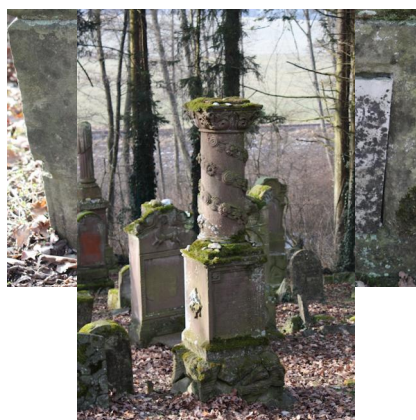
Jüdischer Friedhof Ichenhausen.