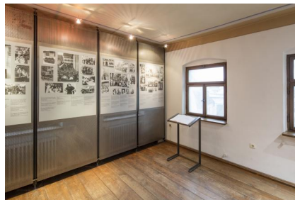
Die Dauerausstellung in der ehemaligen Synagoge Ichenhausen.