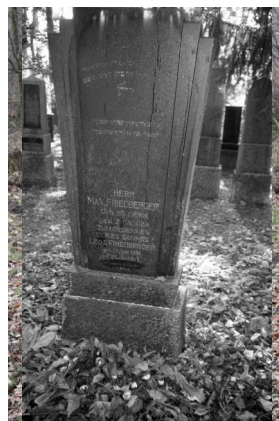
Jüdischer Friedhof Ichenhausen.