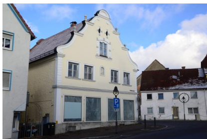
Ehemaliges jüdisches Wohnhaus, sogenanntes Friedberger-Haus, Wiesgaase 1. Repräsentativer