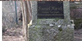
Jüdischer Friedhof Ichenhausen.