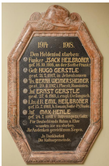
Gedenktafel in der ehemaligen Synagoge Ichenhausen für die im Ersten Weltkrieg gefallenen jüdischen Einwohner Ichenhausens.

In Ichenhausen gibt es im Eingangsbereich der ehemaligen Synagoge und auf dem Ortsfriedhof insgesamt drei Gedenktafeln für die jüdischen Gefallenen des Ortes, außerdem erinnern die Inschriften von drei Gräbern auf dem jüdischen Friedhof an gefallene Kriegsteilnehmer.