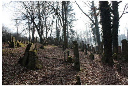
Jüdischer Friedhof Ichenhausen.