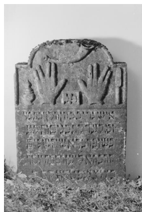
Grabstein des Rabbiners Josef Katz in Ichenhausen, Steinbildwerk, 1796, Ichenhausen, Jüdischer Friedhof.