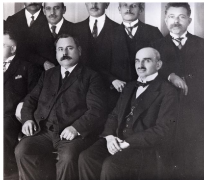
Gruppenaufnahme der Ichenhausener Stadträte anlässlich der Eröffnung des Rathauses 1927.

Harburger 1927).