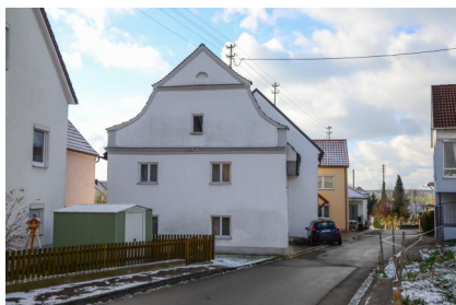
Ehemaliges jüdisches Wohnhaus, Hoher Brühl 3, &nbsp;im Kern 17. Jh., Anfang 19 Jh. überformt.