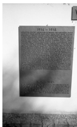
Ichenhausen, Kriegerdenkmal auf dem Ortsfriedhof, Detailansicht mit Namenstafel 1914-18 (Aufnahme Israel Schwierz, 1996). Copyright BayHStA, BS N 80 80/71-05