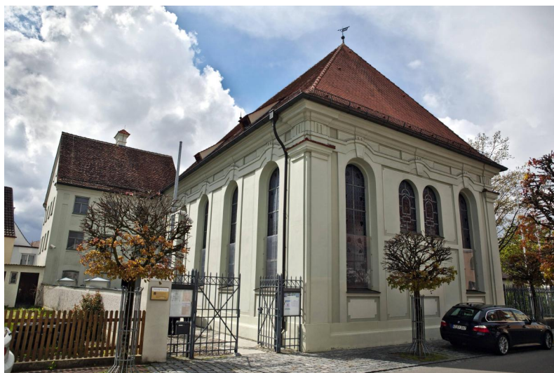
Außenansicht der ehemaligen Synagoge Ichenhausen, 2011.

Eine erste Synagoge ist in Ichenhausen im Jahr 1687 erwähnt. Sie war aufgrund der stark gestiegenen Anzahl von Gemeindemitgliedern aber schon bald zu klein geworden. Ab 1730 nutzte man daher einen zusätzlichen Betsaal in der Ostergasse. 1762 kaufte die Kultusgemeinde den an die Synagoge angrenzenden Garten und ließ 1781 auf dem vergrößerten Grundstück (neu: Vordere Ostergasse 22) einen repräsentativen, geräumigen Sakralbau mit südwestlich angebautem Rabbinerhaus errichten. Das Portal der alten Synagoge wurde dabei übernommen.