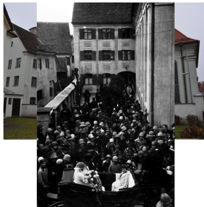
Außenansicht der ehemaligen Synagoge Ichenhausen, 2011.