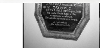
Ichenhausen, Gedenktafel für die gefallenen jüdischen Gemeindemitglieder in der ehem. Synagoge.