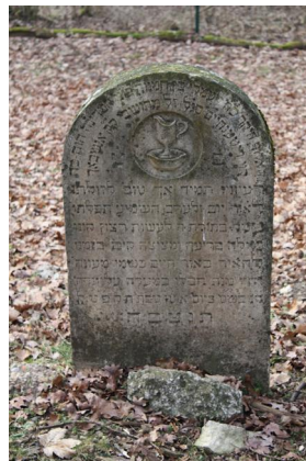
Jüdischer Friedhof Ichenhausen.