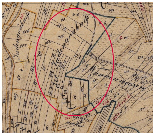
Burgau, &nbsp;Uraufnahme 1808-1864 (Ausschnitt). Westlich der nördlichen Landstraße, etwa eine halbe Stunde Fußmarsch von der Burgauer Stadtmauer entfernt, lag der Flurname "Ober[halb] der Judenbegräbnis".