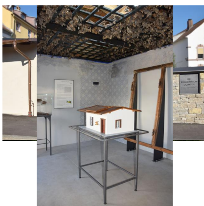
Blick auf den "Judenhof", ein Gebäude des ehemaligen Klosters Untierzell.