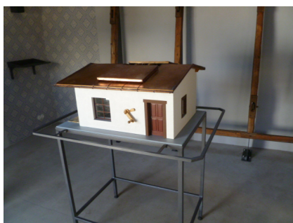
Zell am Main, Außenansicht der Rosenbaumschen Laubhütte (Aufnahme 2023).