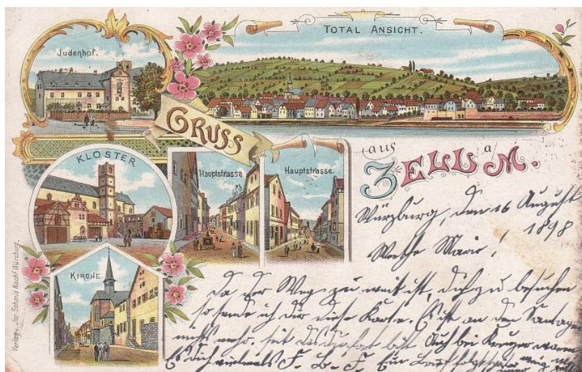
Auf der 1898 verschickten Postkarte ist links oben der Gebäudekomplex "Judenhof" hervorgehoben. Hier wird auch der Betsaal der jüdischen Gemeinde vermutet.

Die jüdische Gemeinde in Zell, die vom Anfang des 19. Jahrhunderts bis in das erste Jahrzehnt des 20. Jahrhunderts bestand, nutzte wahrscheinlich einen Betsaal. Dieser befand sich im Gebäudekomplex "Judenhof", das von Rabiner Mendel Rosenbaum aus der Versteigerungsmasse des Klosters Unterzell angekauft wurde.