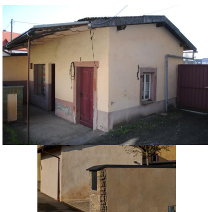
Ehemaliges Waschhaus im Wirtschaftshof von Kloster Untierzell (Judenhof 1a), dann Umbau zur Laubhütte, sogenannte Sukka, in der 2. Hälfte 19. Jahrhundert, ein eingeschossiger Massivbau mit flachem Satteldach (Aufnahme 2022).