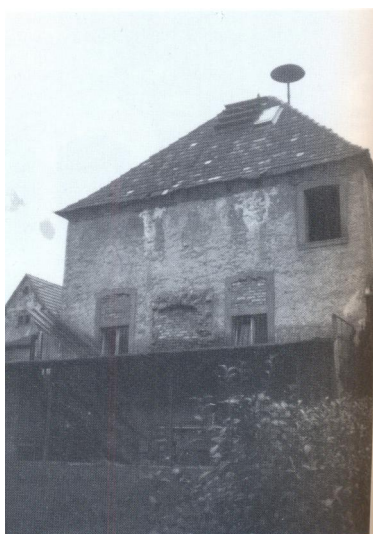
Gebäude der ehemaligen Synagoge von Unterleinach, das 1991 abgerissen wurde (Aufnahme 1980er Jahre).

Ein erster Betraum der jüdischen Gemeinde Leinach war ein Haus des jüdischen Einwohners Schmul (Schmuhls Häuschen, Rathausstraße/Riedstraße) vorhanden. Ein "Schmul Jud" wurde bereits 1774 genannt und ist bis 1811 verstorben. Die Befriedigung der Ansprüche der Gläubiger aus dem vorhandenen Nachlass musste von Amts wegen geregelt werden. Vielleicht hat dieser Vorfall und die auf 39 Mitglieder angewachsene jüdische Gemeinde die Verantwortlichen zu einem Neubau einer Synagoge bewogen.