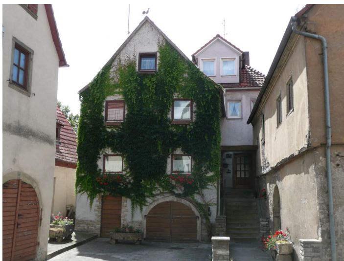
In der Bildmitte das ehemalige Lehrer- und Schulhaus, im Hintergrund die Nordansicht der ehemaligen Synagoge Goßmannsdorf (Aufnahme 2013).