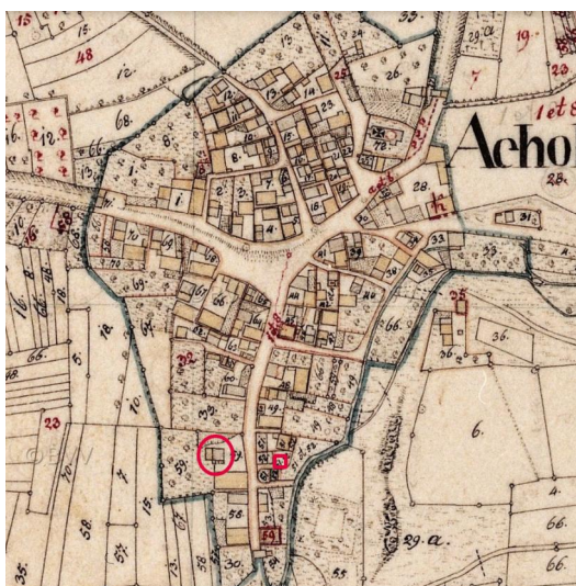
Acholdshausen, Uraufnahme 1808-1864 (Ausschnitt), gegenüber der Synagoge (im Kreis) der Standort der 1863 erbauten Mikve.

In Acholshausen bestand eine jüdische Gemeinde wahrscheinlich seit dem 16. Jahrhundert. 1580 und 1589 gibt es erste Nennungen von Juden. Um 1800 lebten unter dem Schutz des Würzburger Stiftes Haug 42 Personen jüdischen Glaubens im Ort: 7 Männer, 6 Frauen, 24 Kinder und 5 Bedienstete. Die Familien besaßen ein Haus oder eine Haushälfte, die Männer waren im Handel tätig.