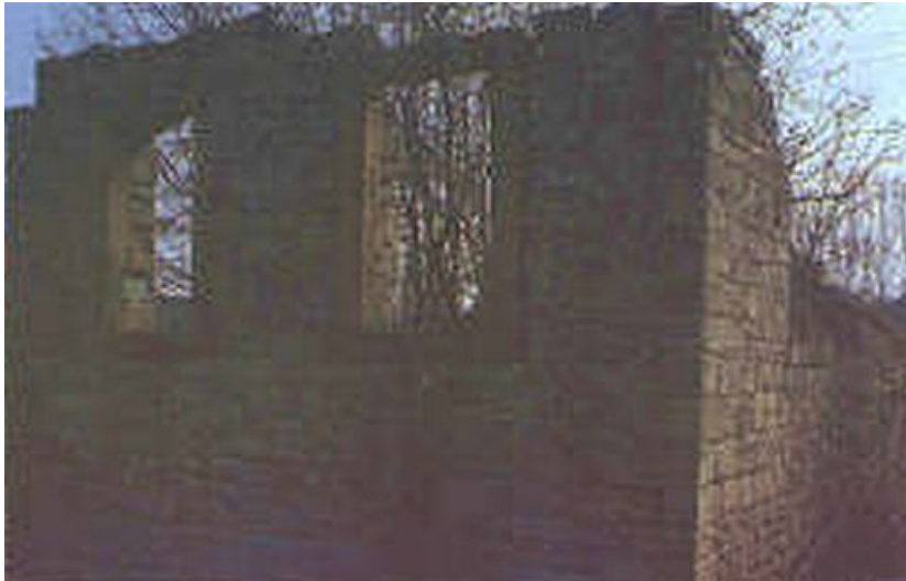
Mauerreste der ehemaligen Synagoge Acholshausen.

Die jüdische Gemeinde bestand in Acholshausen seit dem 16. Jahrhundert. Der genaue Zeitpunkt der Erbauung der Synagoge ist nicht bekannt. Der Zeitpunkt des Synagogenbaus entweder um 1850 oder 1882 angenommen. Die kleine Synagoge (Standort heute: Obere Gasse 1) war an ein 1834 errichtete Wohnhaus angebaut. Auf dem Anwesen Hugo-Wilz-Straße 8-9, nahe dem Gotteshaus, befand sich ab 1863 eine Mikwe. Nach Auflösung der Gemeinde dürfte die Synagoge nicht mehr in Gebrauch gewesen sein. Sie war bereits 1922 in einen reparaturbedürftigen Zustand, ein geplanter Abbruch des Gebäudes kam aber nicht zustande. Die Synagoge wurde beim Novemberpogrom 1938 beschädigt. Bei einem Luftangriff 1944 brannte das Gebäude fast vollständig ab: Es ist heute nur noch eine Mauer erhalten.