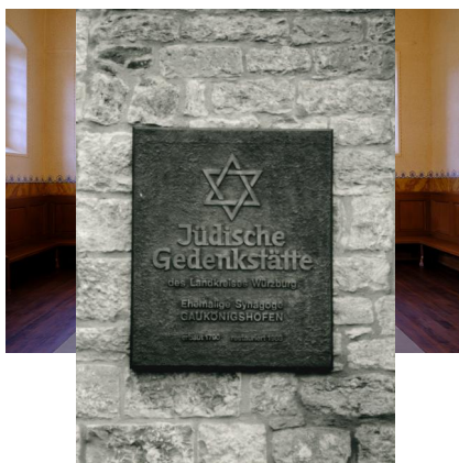
Gaukönigshofen, Königshof 22, ehem Synagoge - Blick auf den Toraschrein (Aufnahme 2022).