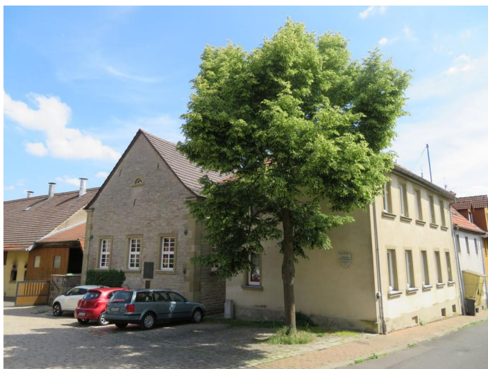
Gebäude der ehemaligen Synagoge (links) und Gebäude des ehemaligen jüdischen Schule.