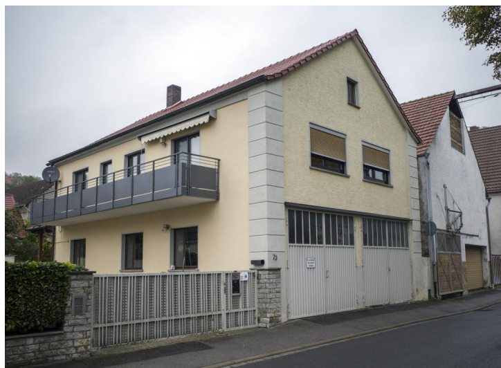
Ehemalige Synagoge, zweigeschossiger giebelständiger Satteldachbau mit Ecklisenen, 1856; 1961 stark überformt.

Laut einem vermutlich 1749 verfassten Schreiben der Schonunger Juden fand der jüdische Gottesdienst zu dieser Zeit nur in einem kleinen Zimmer statt. Da die jüdische Gemeinde zu diesem Zeitpunkt von vier auf neun Familien gewachsen war, bat sie den Würzburger Fürstbischof, auf einem bereits der Gemeinde gehörenden Grundstück eine neue Synagoge mit einer Wohnung für den Lehrer errichten zu dürfen. Vermutlich erhielt die jüdische Gemeinde relativ rasch die Baugenehmigung: 1817 vermerkte eine vom Amt Mainberg durchgeführte Erhebung, dass die damalige Schonunger Synagoge rund 70 Jahre alt sei. 1762 wirkte dort ein Schmuël als Rabbiner. Die Lage der ersten Mikwe ließ sich bisher nicht nachweisen.