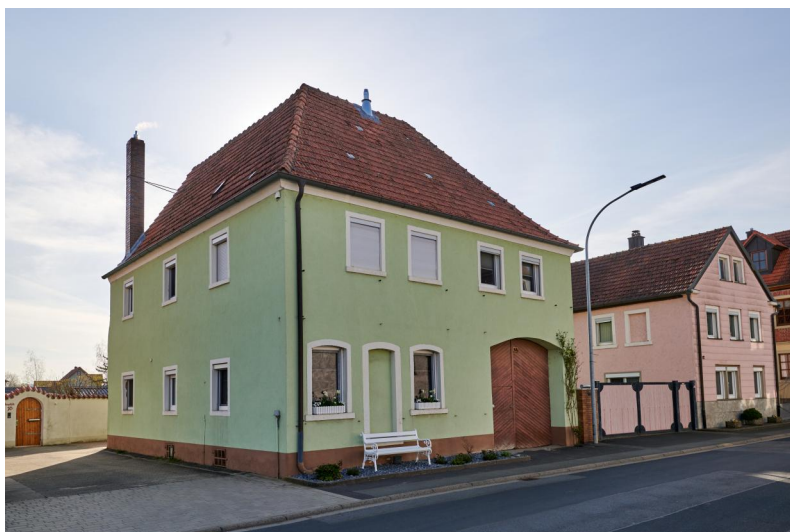
Gebäude der ehemaligen Synagoge Lülsfeld. Der Betsaal befand sich im Erdgeschoß des Vorgängerbaus, von dem nur noch die Grundmauern erhalten sind (Aufnahme 2021).

Der Standort einer ersten, bereits im 17. Jahrhundert benutzten Synagoge bzw. Betsaales ist nach aktuellem Stand nicht zu ermitteln. Da 1762 dieses Gotteshaus baufällig geworden war und der Schutzherr einen Neubau genehmigt hatte, planten die führenden Gemeindemitglieder Abraham (Fromm) und Hirsch Isa[a]c, einen geeigneten Bauplatz zu erwerben. Das ins Auge gefasste Grundstück verfügte allerdings nicht mehr über das Gemeinderecht, und dem damit verbundenen Anspruch auf Baumaterial vom Gemeindegrund. Deswegen lehnte die Gemeindeverwaltung des Dorfes auch ab, für die zu errichtende Synagoge das Baumaterial zu stellen.