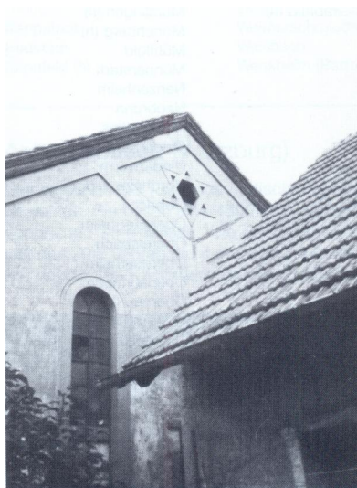
Ehemaliges Synagogengebäude Obereuerheim (Aufnahme um 1980).

1782 errichtete die Obereuerheimer jüdische Gemeinde mit Erlaubnis der Gräflin Schönborn'schen Dorfherrschaft eine neue Synagoge. Möglicherweise stand sie bereits in der Judengasse südwestlich von Schloss Euerheim. Laut Überlieferung soll auch die Mikwe Teil eines Gebäudes in der Judengasse gewesen sein. Im 1833 aufgenommenen Urkataster wird der jüdischer Kultbau zwar nicht berücksichtigt, das kann jedoch der individuellen Sorgfalt des Kartographen geschuldet sein kann - auch wenn viele Synagogen farblich oder mit einem eingezeichneten Davidstern gekennzeichnet sind, war dies nicht zwingend vorgeschrieben.