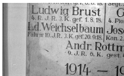
Geldersheim, Gedenktafel - Detailsicht mit dem Namen von Ludwig Weichselbaum (Aufnahme Israel Schwierz, 1996). Copyright BayHStA, BS N 80 80/106-10

In Geldersheim wurde eine Kapelle am Ortsausgang in Richtung Würzburg an der Kreuzung Würzburger Straße, Ecke Frankenstraße – Kapellenweg als Denkmal für die Gefallenen beider Kriege errichtet. Im Inneren des Gebäudes sind links und rechts der Tür Gedenktafeln angebracht. Auf der linken Tafel kann man die Namen der Gefallenen sehen, unter ihnen auch den des jüdischen deutschen Soldaten LD. WEICHELBAUM Fahrer 10. I.R. 3. K. gef. 20.9.18.