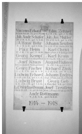
Geldersheim, Gedenktafel mit dem Namen von Ludwig Weichselbaum.

In Geldersheim wurde eine Kapelle am Ortsausgang in Richtung Würzburg an der Kreuzung Würzburger Straße, Ecke Frankenstraße – Kapellenweg als Denkmal für die Gefallenen beider Kriege errichtet. Im Inneren des Gebäudes sind links und rechts der Tür Gedenktafeln angebracht. Auf der linken Tafel kann man die Namen der Gefallenen sehen, unter ihnen auch den des jüdischen deutschen Soldaten LD. WEICHELBAUM Fahrer 10. I.R. 3. K. gef. 20.9.18.