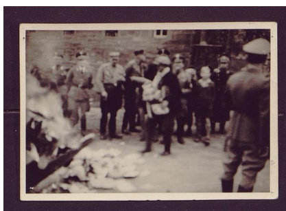
Pogrom in Frankenwinheim: Am Nachmittag des 10. November 1938 trieben Uniformierte die jüdischen Frankenwinheimer unter Fußtritten und Schlägen in die verwüstete Synagoge. Sie mussten unter dem Gespött der Zuschauer die Trümmer der Inneneinrichtung auf einen brennenden Scheiterhaufen auf der Dorfstraße werfen. Zum Spott band man ihnen Tücher und Schals um und setzte ihnen Hüte auf. Unter den zahlreichen Schaulustigen befand sich auch ein Lehrer mit seiner Schulklasse.