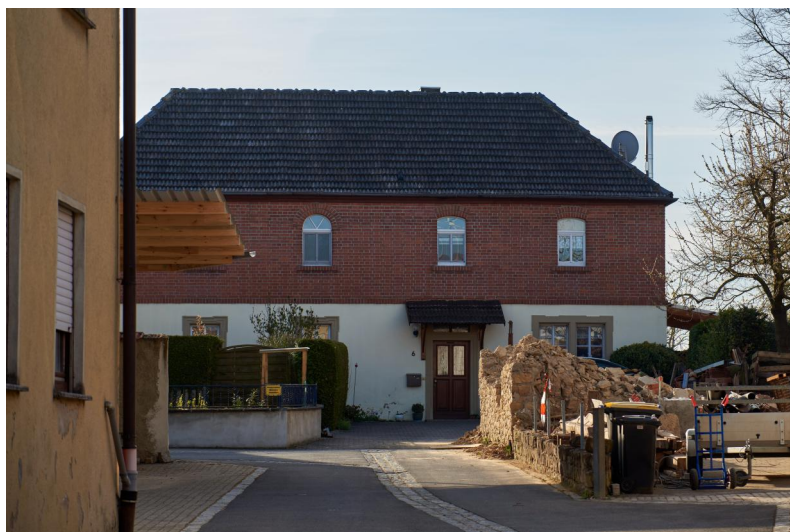
Das zu einem Wohnhaus umgebaute Gebäude der ehemaligen Synagoge Frankenwinheim, 2021.

Eine Synagoge ist in Frankenwinheim erstmals 1749 urkundlich nachweisbar, als eine Aufstellung der Schönbornschen Schlossgüter die Existenz einer "Judenschul" auf einem Feld erwähnt. Die Synagoge lag am Rand der Ortschaft im Südosten Frankenwinheims und war hinter Scheunen und Höfen versteckt.