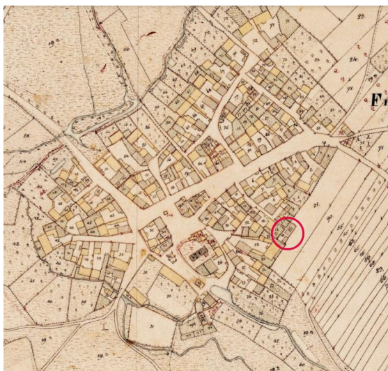
Frankenwinheim, Uraufnahme 1808-1864 (Ausschnitt). Die Synagoge am Ortsrand (im roten Kreis) wurde durch den Kartographen mit den Mosaïschen Gesetzestafeln gekennzeichnet.