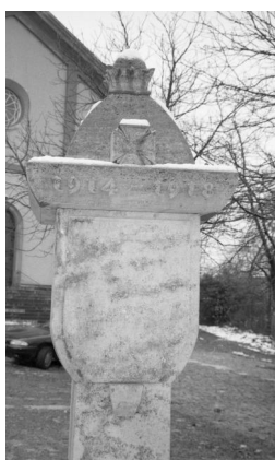
Floss, Kriegerdenkmal - Rückseite.