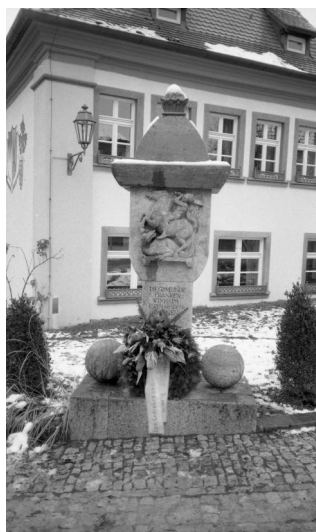
Frankenwinheim, Kriegerdenkmal am Kirchberg.

Das alte Kriegerdenkmal von Frankenwinheim steht in der Ortsmitte oberhalb des Rathauses am Kirchberg.