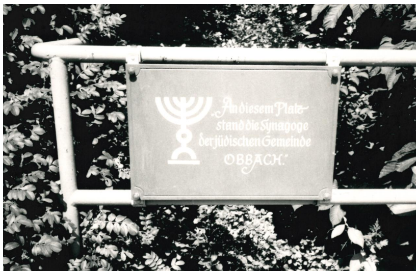
Gedenktafel zur Erinnerung an die Synagoge in Obbach, Aufnahme 1987.

Laut der um 1850 erfolgten Kataster-Uraufnahme lag die erste, 1764 erbaute Obbacher Synagoge in der Nähe des Schlossguts. Dort wirkte Mendel Simon mehrere Jahrzehnte als Vorsänger und konnte 1829 auf 57 Dienstjahre zurückblicken. Da die alte Synagoge renovierungsbedürftig war, teilte die Obbacher Kultusgemeinde Anfang 1860 dem zuständigen Landgericht Werneck mit, dass sie plane, eine neue Synagoge zu bauen. Zuerst stand das Landgericht dem Bauvorhaben kritisch gegenüber, da die jüdische Gemeinde nur "mittelmäßig begütert" sei.