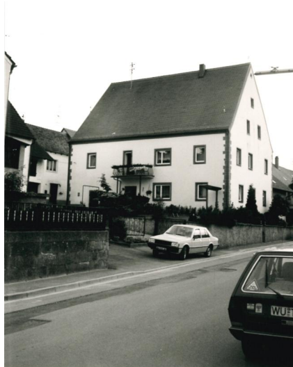
Gebäude der ehemaligen Synagoge Traustadt nach dem Umbau zu einem Wohnhaus (Aufnahme 1987).

Nur wenig ist über die Synagoge von Traustadt bekannt, und von diesem wenigen ist nichts wirklich gesichert: Das Gebäude der Synagoge soll 1829 von der jüdischen Gemeinde erworben worden sein und blieb bis zu ihrer Auflösung im ausgehenden 19. Jahrhundert in Benutzung. Der Verkauf an eine christliche Privatperson soll 1906 erfolgt sein, und heute wird das Gebäude mit einigen Umbauten als Wohnhaus genutzt.