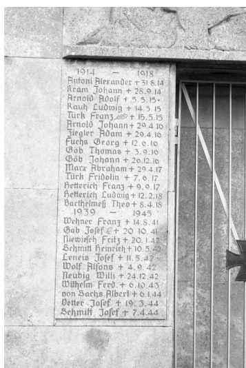
Traustadt, Kriegerdenkmal, Detail mit Namenstafel (Aufnahme Israel Schwierz, 1996). Copyright BayHStA, BS N 80 80/24-25A

In Traustadt, einem Ortsteil der Gemeinde Donnersdorf, existiert für die Gefallenen beider Weltkriege ein Kriegerdenkmal am Julius-Echter-Ring, unmittelbar links neben der kath. Kirche St. Kilian und Gefährten. Auf zwei Steintafeln, zwischen denen sich ein Tor befindet, sind die Namen der Gefallenen der beiden Weltkriege aufgeführt. Auf der äußersten linken Tafel steht unter den Namen auch jener des jüdischen Gefallenen