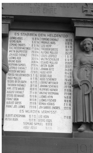
Urspringen, Kriegerdenkmal an der kath. Pfarrkirche Maria-vom-Berge-Karmel (Aufnahme Israel Schwierz, 1996). Copyright BayHSTA, BS N 80 80/105-08A

Das Kriegerdenkmal 1914-18 befindet sich an der Außenwand der kath. Pfarrkirche Maria-vom-Berge-Karmel. Unter der Widmung UNSERN GEFALL. HELDEN ZUR EHRE / ES STARBEN DEN HELDENTOD stehen auch die jüdischen Kriegstoten