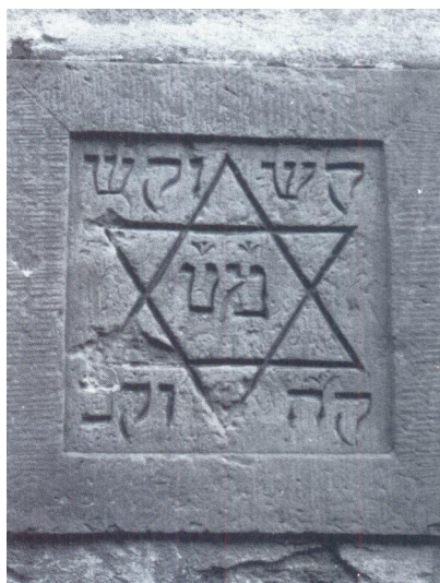
Chuppastein an der ehemaligen Synagoge Urspringen (Aufnahme 1980er Jahre).

Mitte des 17. Jahrhunderts lebten nachweislich bereits zwölf jüdische Familien in Urspringen, was bereits damals eine Synagoge bzw. einen Betraum wahrscheinlich machte. In einer Bittschrift aus dem Jahr 1700/1701 wird eine "Schul" im Haus des Vaters des Juden Götz erwähnt, die es schon "seit vielen Jahren" gab, deren Standort jedoch nicht genannt wird. Das gräfliche Haus genehmigte gegen eine Zahlung von jährlich fünf Gulden die weitere Nutzung. 1702 erwarb die Urspringer Kultusgemeinde den Synagogenteil des Hauses. Ob die stetig wachsende Zahl der Betenden hier noch Raum fand, oder auch woanders der Gottesdienst gefeiert wurde, ist nicht bekannt. Im Jahr 1742 wird in den Quellen erstmals ein "Rebbe in Urspringen" erwähnt.