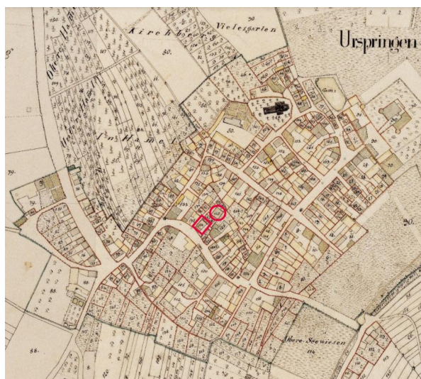
Urspringen, Uraufnahme 1808-1864 (Ausschnitt). Der Standort des Schulhauses (Judengasse 1) ist im Quadrat, die Synagoge (Judengasse 5) im Kreis markiert.

Eine Rechtsquelle des Würzburger Verwaltungsbezirks Rothenfels erwähnt einen Streit zwischen zwei Sendelbacher und einem Urspringer Juden wegen des Fährlohns auf der Sendelbacher Fähr im Jahr 1566. Die Gült- und Zinsbücher der Familie der Kottwitz von Aulenbach verzeichnen ab 1597 Schutzjuden im Urspringen. 1655 werden bei der "Judenzählung", die in den Amtsbezirken des Fürstbistums Würzburg erfolgte, für Urspringen zwölf Familien mit 45 Personen genannt. Die Grafen von Castell, die ab 1699 ihr Lehen selbst verwalteten, legten als jährliches Schutzgeld zwölf Gulden fest, Witwen zahlten die Hälfte. Dazu kamen noch eineinhalb Gulden Frongeld zur Ablösung der Hand-, Spann- und Baudienste, sowie die allgemeinen Abgaben.