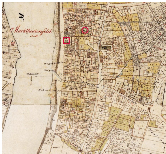
Marktheidenfeld, Uraufnahme 1808-1864 (Ausschnitt). Der erste Betraum (Mainkai 7) ist im Quadrat, der zweite Betraum in der Glasergasse 5 im Kreis hervorgehoben.

Abgesehen von einer Handwerkerfamilie, die 1596 aus Remlingen vertrieben wurde und hier Fuß fassen konnte, gab es in Marktheidenfeld bis ins letzte Drittel des 19. Jh. kein jüdisches Leben. Der Ort fiel zusammen mit dem Großherzogtum Würzburg 1814 an das Königreich Bayern. Erst nach der Aufhebung des Matrikelparagraphen im Jahr 1861 kam es nach und nach zur Ansiedlung von Juden, da der Markt einen attraktiven Handelsplatz darstellte: 1880 gab es sechs jüdische Mitbürger, bis 1910 war ihre Zahl auf 25 Mitglieder gewachsen. Die meisten stammten aus den Nachbarorten Homburg und Urspringen . Die Marktheidenfelder Juden gehörten bis 1909 der IKG Karbach an (Vertrag von 1903), und nutzten auch den örtlichen Verbandsfriedhof.