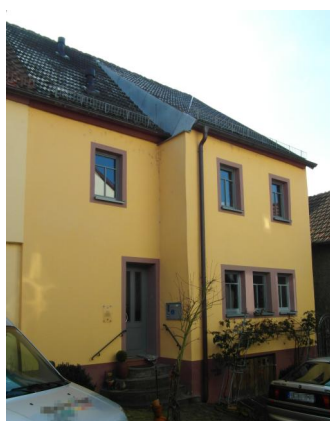
Marktheidenfeld, Ehemaliges Haus Adler in der Glaserstraße 5, in dem sich der zweite Gebetsraum der jüdischen Gemeinde befand (Aufnahme 2015).