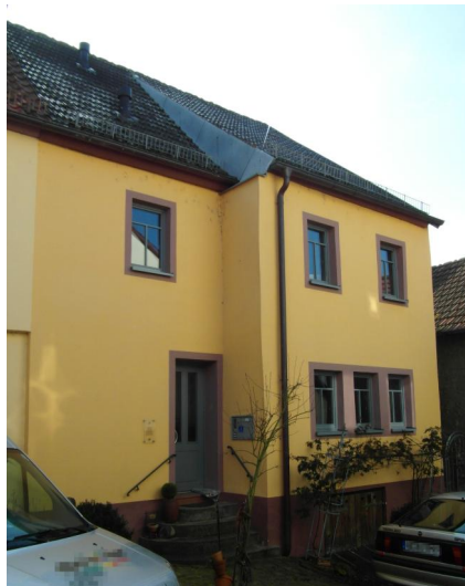
Marktheidenfeld, Ehemaliges Haus Adler in der Glasergasse 5, in dem sich der zweite Gebetsraum der jüdischen Gemeinde befand (Aufnahme 2015).

Die 1909 fundierte Kultusgemeinde Marktheidenfeld reichte noch im Gründungsjahr einen Plan für einen Betsaal beim zuständigen Distriktsrabbinat Würzburg ein. Er sollte im Privathaus von Andreas Stumpf am Mainkai (Haus-Nr. 261, Heute: Mainkai 7) eingerichtet werden. Bedenken des Rabbiners Nathan Bamberger wegen einiger Unzulänglichkeiten wurden mit dem Argument entkräftet, dass es sich dabei nur um ein Provisorium handle. Das quadratische, dicht möblierte Zimmer befand sich im Obergeschoss des Hauses und ermöglichte die Gottesdienste nur in drangvoller Enge. 1912 unterstützte das Bezirksamt einen Antrag zur Förderung der finanzschwachen Kultusgemeinde, da immer noch Gegenstände für den Gebetsraum fehlten.