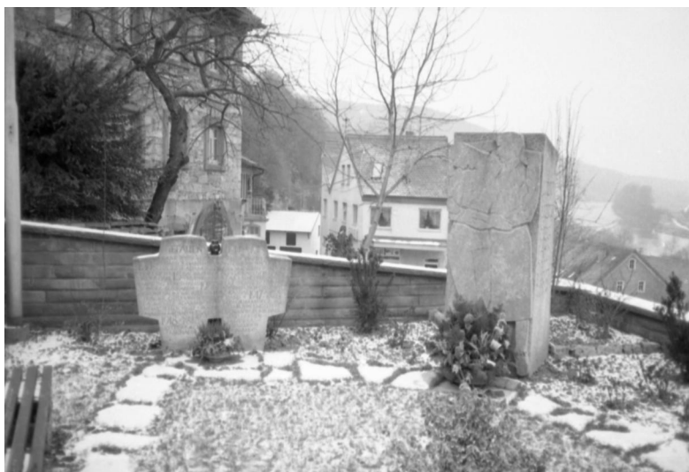
Homburg am Main, Kriegerdenkmal für die Gefallenen und Vermissten beider Weltkriege (Aufnahme Israel Schwierz, 1996). Copyright BayHStA, BS N 80 80/21-02A

In Homburg findet man ein geschmackvolles, 1964 errichtetes, mehrteiliges Kriegerdenkmal für die Gefallenen und Vermissten beider Weltkriege auf dem Julius-Echter-Platz gegenüber dem Schloß. Unter der Widmung GEFALLEN 1914 – 1918 stehen auch die Namen zweier jüdischer Soldaten: