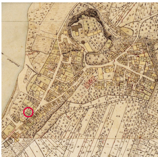
Homburg a.M., Uraufnahme 1808-1864 (Ausschnitt). Die Synagoge am südwestlichen Ortsrand ist im roten Kreis markiert.