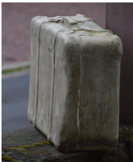
Ein Koffer und ein Kinderrucksack erinnern nahe des ehem. Synagogenstandorts an die Shoah (Aufnahme während der Einweihung 2020). Die Informationstafel liefert zusätzliche Details, das "Zwillingsstück" der Skulptur erweitert den DenkOrt Deportationen in Würzburg.

Jüdisches Leben ist in Gemünden bereits Ende des 13. Jahrhunderts nachweisbar. Das Nürnberger Memorbuch verzeichnet unter den Opfern des Rintfleischpogroms 1298 auch Opfer aus Gemünden, die von judenfeindlichen Horden ermordet wurden. Aus den folgenden Jahrzehnten existieren dann nur spärliche Nachrichten über einzelne Juden, die aus Gemünden stammten und als Neubürger in Nürnberg erfasst wurden. Erst 1558 ist unter der Herrschaft des Würzburger Bischofs Melchior Zobel von Giebelstadt (reg. 1544-1558) wieder ein Schutzjude aus Gemünden verzeichnet. Unter Melchiors Nachfolger Friedrich von Wirsberg (reg. 1558-1573) war es jedoch alle Juden wieder verboten, sich im Hochstift Würzburg anzusiedeln.