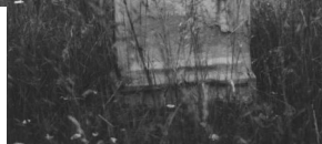
Jüdischer Friedhof Hüttenheim.