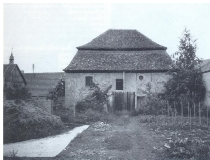
Gebäude der ehemaligen Synagoge Hüttenheim (Aufnahme 1980er-Jahre).