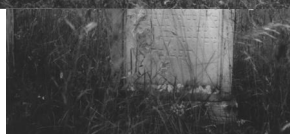
Jüdischer Friedhof Hüttenheim.