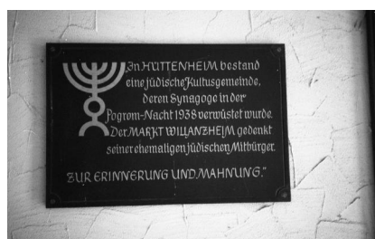
Hüttenheim, Gedenktafel an die ehem. Kultusgemeinde Hüttenheim (Aufnahme Israel Schwier, 1996). Copyright BayHStA, BS N 80 80/109-21

Nach 1945 zogen zunächst Heimatvertriebene in das Synagogengebäude, das sich heute in Privatbesitz befindet. Der Familie Kalbhenn-Link gehört auch das benachbarte "Vorsängerhaus" mit Mikwe. Für die sorgfältige Restaurierung der ehemaligen Synagoge wurden die Eigentümer 2009 mit der bayerischen Denkmalschutzmedaille ausgezeichnet. Eine Hinweistafel verweist auf die Geschichte des Gebäudeensembles.