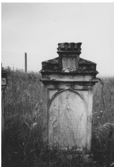
Jüdischer Friedhof Hüttenheim.

Der jüdische Friedhof liegt außerhalb des Ortes an einem abschüssigen Hang inmitten von Weinbergen in Richtung Nenzenheim. Er hat eine Größe von fast 4000 qm und wurde 1816 angelegt. Es werden fast 500 Gräber gezählt.