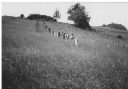
Jüdischer Friedhof Hüttenheim.

Israel Schwierz hat uns großzügigerweise die Originalfotos zu seiner 1988 erschienenen Dokumentation „Steinerne Zeugnisse jüdischen Lebens in Bayern“ überlassen. Dafür gilt ihm unser großer Dank. Diese Fotografien stellen gerade im Hinblick auf die in vielen Fällen in den letzten 25 Jahren sehr rasch fortgeschrittene Verwitterung der Grabsteine eine wertvolle Quelle dar.