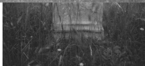
Jüdischer Friedhof Hüttenheim.