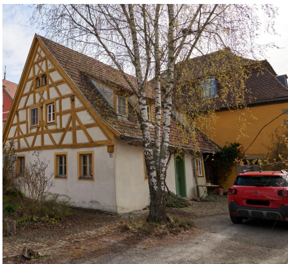
Hüttenheim, im der Bildmitte sogenanntes "Vorsängerhaus", eingeschossiger Steilsatteldachbau mit Fachwerkgiebel und Mikwe (1980 verfüllt). Rechte Bildseite das Gebäude der ehemaligen Synagoge von 1754 (Aufnahme 2021).

Eine Hüttenheimer Besonderheit stellt das Ensemble aus zwei ehemaligen Synagogen dar, die in unmittelbarer Nachbarschaft gelegen sind. 1715 richteten die Schutzjuden an den Fürsten von Schwarzenberg das Gesuch, in einem jüdischen Wohnhaus eine Synagoge einrichten zu dürfen, da sie ihre alte Synagoge (Standort unbekannt) zuvor an einen christlichen Hüttenheimer verkauft hatten. Die Wiener Kanzlei des Fürsten Schwarzenberg erteilte die Erlaubnis noch im selben Jahr. Die jüdische Gemeinde richtete im Dachgeschoss die Synagoge ein, im Erdgeschoss die Lehrerwohnung und grub im Keller eine Mikwe frei.