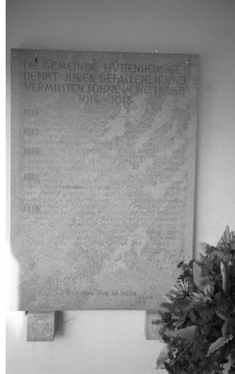
Hüttenheim, Gedenktafel für die Gefallenen beider Weltkriege.

In Hüttenheim, das heute zur Gemeinde Willanzheim gehört, gibt es in der Leichenhalle des Dorffriedhofes ein aus zwei Steintafeln bestehendes Denkmal für die Toten beider Weltkriege. Unter der Widmung DIE GEMEINDE HÜTTENHEIM GEDENKT IHRER GEFALLENEN UND VERMISSTEN SÖHNE IM WELTKRIEG 1914–1918 und den darunter stehenden Namen der Gefallenen (auf der linken Seite der Leichenhalle) ist auch der jüdische Soldat Inf. Liebenstein Isak Frankr. verzeichnet.