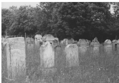
Jüdischer Friedhof Hüttenheim.