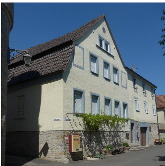
Segnitz, Mainstraße 26, ehem. "Brüssel'sche Handelsschule" (Aufnahme 2020).

Die Dorfherrschaft in Segnitz teilten sich die Markgrafschaft Brandenburg-Ansbach als Rechtsnachfolgerin der säkularisierten Benediktinerabtei Auhausen und die reichsritterschaftliche Familie der Zobel von Giebelstadt, die das vom Hochstift Würzburg vergebene Lehen von den Herren von Ehenheim übernommen hatten. Bereits im 16. Jahrhundert lebten Juden in Segnitz. 1620 wird der Segnitzer Jude Haim erwähnt, als der Zobelsche Schultheiß vorschlägt, sich mit den Herren von Seinsheim und von Seckendorff, die über das benachbarte Marktbreit die Ortsherrschaft ausüben, darauf zu verständigen, Haims Waren zu denselben Bedingungen wie die Waren der in Marktbreit ansässigen Juden zu verzollen.