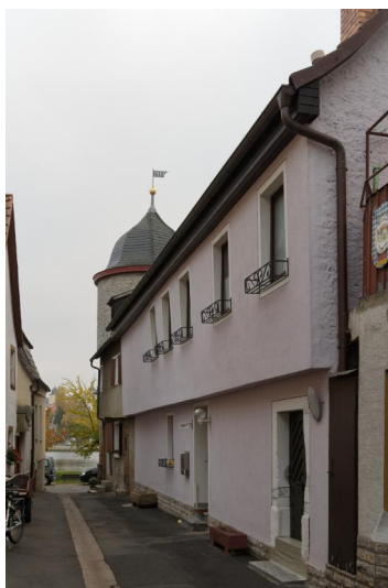
Segnitz, ehem. Synagoge Linsengasse14 (Aufnahme 2011).

Eine Synagoge lässt sich in Segnitz erst in der zweiten Hälfte des 18. Jahrhunderts nachweisen, da ein Dekret des Kammeramts Mainbernheim vom März 1786 eine alljährlich von den Segnitzer Juden zu zahlende Konzessionsabgabe für den Unterhalt der Synagoge vorschreibt. Wahrscheinlich handelte es sich bereits um das Gotteshaus am westlichen Ortsrand von Segnitz, in einem Gebäude aus dem 16. oder 17. Jahrhundert direkt an der Befestigungsmauer (Plan-Nr. 59, heute Linsengasse 14).