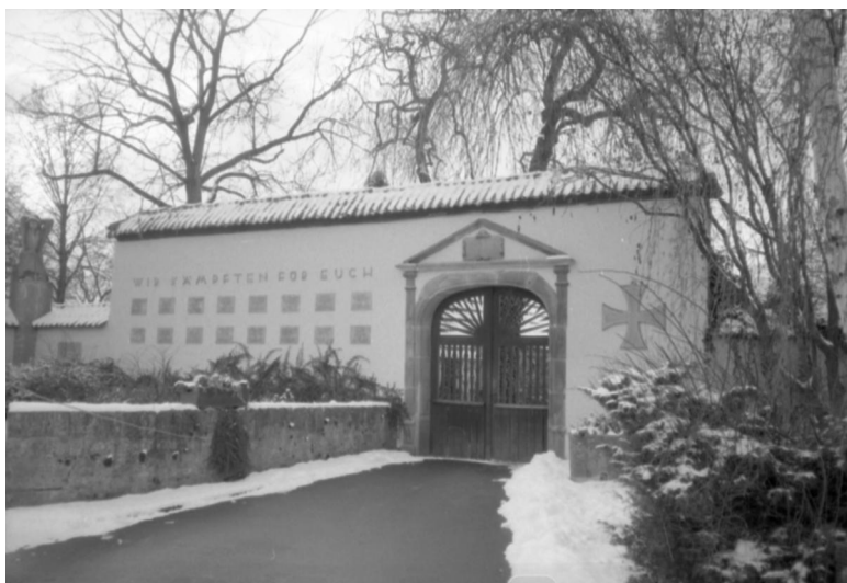
Prichsenstadt, Gedenkstätte für die Gefallenen beider Weltkriege am kommunalen Friedhof.

Die Kriegergedächtnisstätte für die Gefallenen beider Weltkriege befindet sich in Prichsenstadt am bzw. im örtlichen Friedhof: Eine Friedhofsmauer mit Eingangstor wurde als Gedenkstätte eingerichtet.