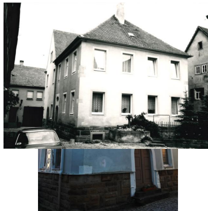
Außenansicht der ehemaligen Synagoge Prichsenstadt (Aufnahme 2016).