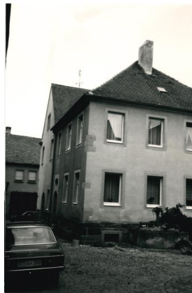
Das ehemalige Synagogengebäude in Prichsenstadt, Aufnahme 1987.