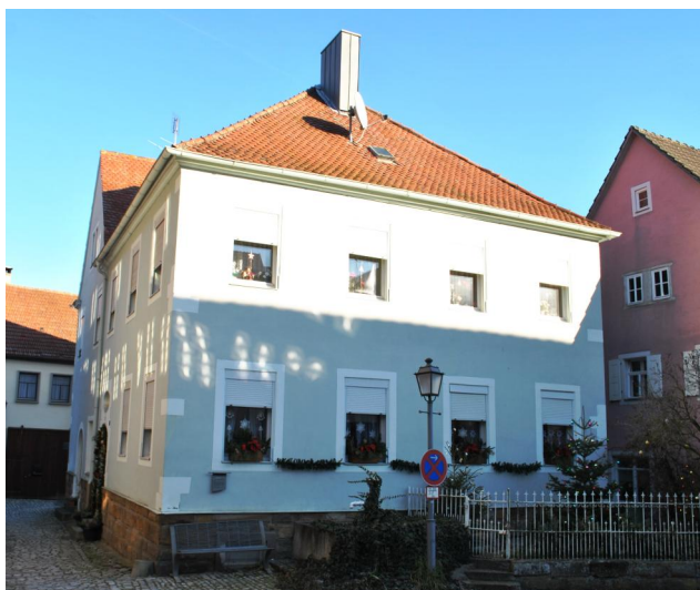
Außenansicht der ehemaligen Synagoge Prichsenstadt (Aufnahme 2016).

Die Nachrichten über die Prichsenstädter Synagoge fließen in dieser Zeit spärlich. Erstmals erwähnt ist eine Synagoge 1734 in einem jüdischen Privathaus. Rund 50 Jahre später erwarb die jüdische Gemeinde 1787 ein wohl aus der Zeit nach dem Dreißigjährigen Krieg stammendes Haus, das an die mittelalterliche Stadtmauer angrenzte. Der von einem Satteldach abgeschlossene Bau war wegen seines unregelmäßigen Grundrisses ursprünglich wohl nicht als Synagoge, sondern als Wohnhaus geplant. Möglicherweise wurde das kleine Gebäude nach dem Erwerb für die Benutzung als Religionsschule und Synagoge umgebaut. Im Obergeschoss waren die nur etwa 22 qm große Synagoge, und der Unterrichtsraum mit etwa zwölf qm untergebracht.