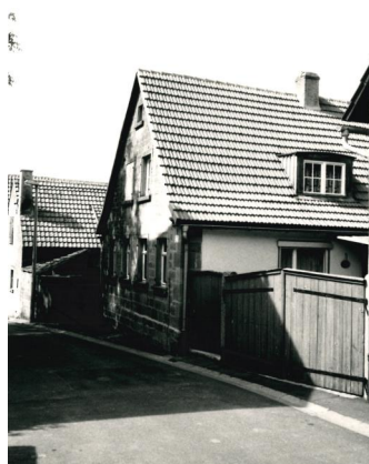
Ansicht der Synagoge Gnodstadt um 1990.