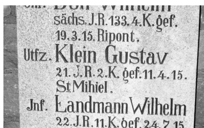
Gnodstadt, Kriegerdenkmal - Detailsicht mit dem Namen von Gustav Klein (Aufnahme Israel Schwierz, 1996). Copyright BayHStA, BS N 80 80/112-09A

Auf der linken Seite der Gedenkstätte sind die Namen der Gefallenen des Ersten Weltkrieges festgehalten, unter ihnen auch der des jüdischen deutschen Soldaten Utfz. KLEIN GUSTAV 21. I.R. 2. K. gef. 11.4.15. St. Mihiel.