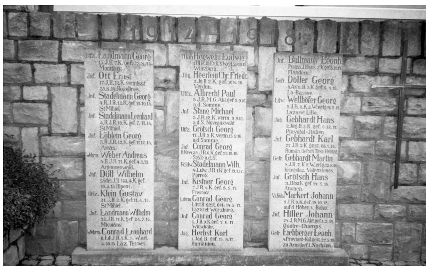
Gnodstadt, Denkmal für die Gefallenen beider Weltkriege (Aufnahme Israel Schwierz, 1996). Copyright BayHStA, BS N 80 80/112-06A

Das Kriegerdenkmal für die Gefallenen beider Weltkriege aus Gnodstadt befindet sich direkt neben der evang.-luth. Kirche St. Peter und Paul Kirche auf dem Friedhof.