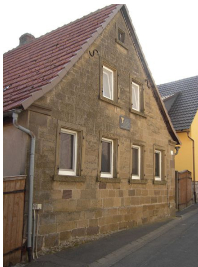
Gebäude der ehemaligen Synagoge Gnodstadt (Schulgartenweg 1) mit der zwischen den Fensterreihen angebrachten Gedenktafel.