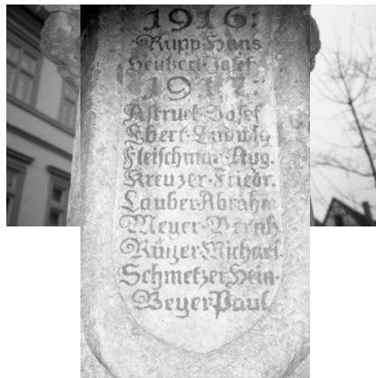
Marktbreit, Kriegerdenkmal mit dem Namen von M. Goldstein und Simon Astruck.