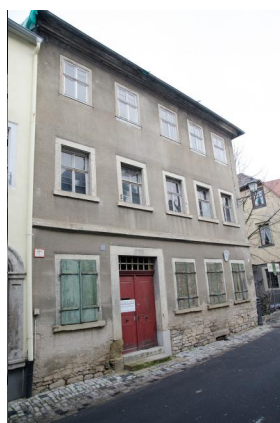
Gedenktafel an der Außenseite der ehemaligen Synagoge mit den Namen der ermordeten Mitglieder der jüdischen Kultusgemeinde Marktbreit.