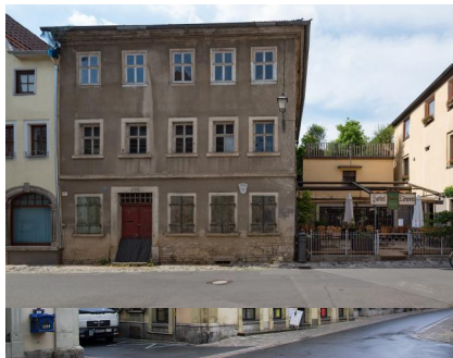
Marktbreit, links Günther'sche Buchhandlung, mittig Wertheimerhaus, Schustergasse 2