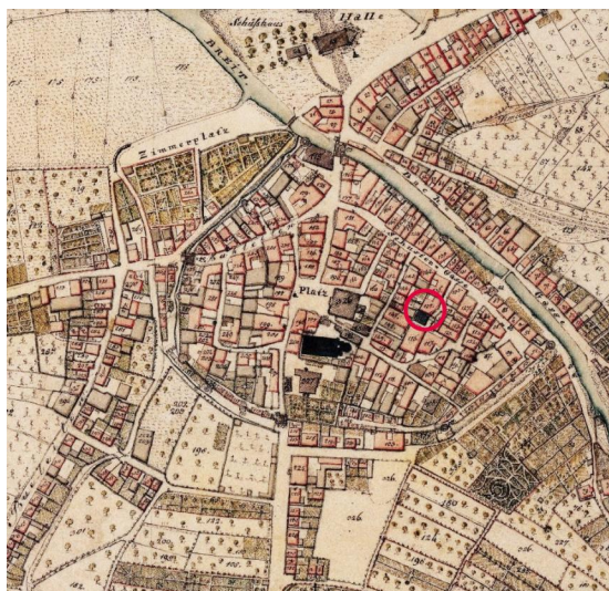
Marktbreit, Uraufnahme dat. 1825 (Ausschnitt). Die barocke, 1885 durch einen Neubau ersetzte Synagoge ist rot markiert.

Ein erster Hinweis auf die Anwesenheit von Juden im damaligen Unternbreit findet sich in einem Eintrag des Segnitzer Gerichtsbuchs vom 18. August 1541, das einen Unternbreiter Juden namens Mos als Gläubiger erwähnt. 1553 wies Dorfherr Georg Ludwig von Seinsheim die Juden aus Unternbreit gegen eine Weinsteuern aus, die seine christlichen Unternbreiter Untertanen zu entrichten hatten. Vier Jahre später erhielt Unternbreit das Marktrecht und wurde zu Marktbreit.