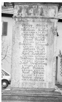
Großlangheim, Kriegerdenkmal mit dem Namen von Karl Fromm (Aufnahme Israel Schwierz, 1996). Copyright BayHStA, BS N 80 80/108-23A

In Großlangheim steht in der Ortsmitte ein sehr schönes Denkmal, bekrönt mit einer Madonna. Unterhalb der Skulptur sind die Namen der Gefallenen verzeichnet, unter ihnen ist auch der des jüdischen deutschen Soldaten Karl Fromm * 6.9.1893 26.3.1918 .