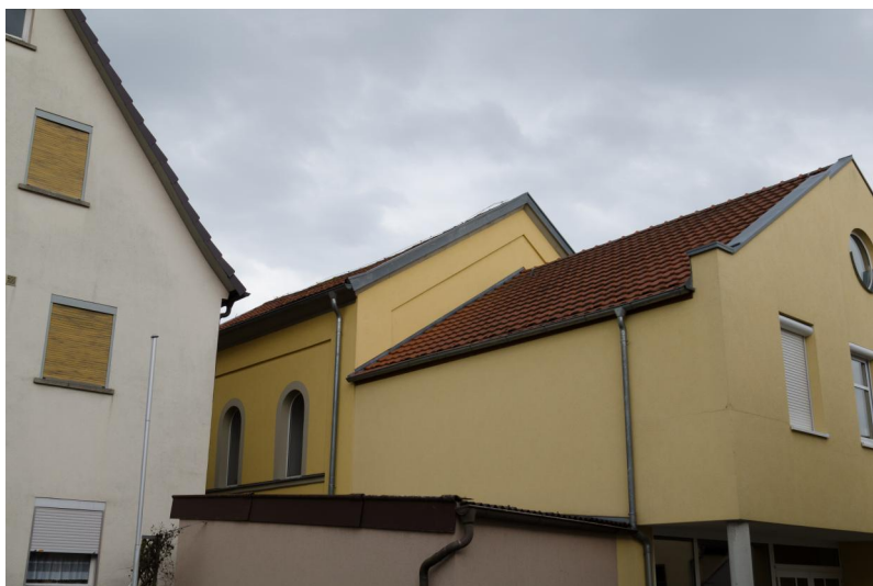
Ehemalige Synagoge, jetzt Kulturhaus, Schloßhof 9.

Eine Synagoge existierte in Großlangheim zu Beginn des 19. Jahrhunderts nicht, da 1809 im Zusammenhang mit der Tätigkeit eines jüdischen Schullehrers ein angemieteter Gebetsraum erwähnt wird. Rund eineinhalb Jahrzehnte danach griff die jüdische Kultusgemeinde 1826 den Vorschlag des Landgerichts Kitzingen von 1809 auf und plante den Bau einer Synagoge. Das Landgericht unterstützte eine geplante landesweite Kollekte, jedoch lehnte die Kreisregierung das Projekt 1827 ab, da für eine offizielle Synagoge zumindest 50 Familien im Ort leben müssten.