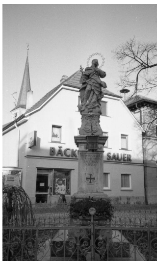
Großlangheim, Kriegerdenkmal mit Madonna (Aufnahme Israel Schwierz, 1996). Copyright BayHStA, BS N 80 80/109-23

In Großlangheim steht in der Ortsmitte ein sehr schönes Denkmal, bekrönt mit einer Madonna. Unterhalb der Skulptur sind die Namen der Gefallenen verzeichnet, unter ihnen ist auch der des jüdischen deutschen Soldaten Karl Fromm * 6.9.1893 26.3.1918 .