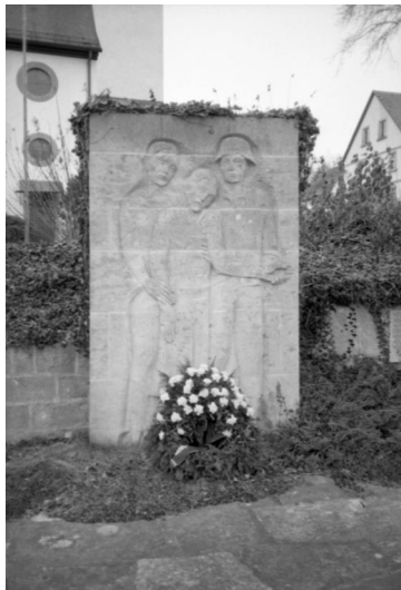
Ermershausen, Denkmal für die Gefallenen beider Weltkriege, zentrales Relief.

In Ermershausen erinnert das Kriegerdenkmal in der Ortsmitte und ein Grabstein auf dem Jüdischen Friedhof an bayerische jüdische Soldaten.