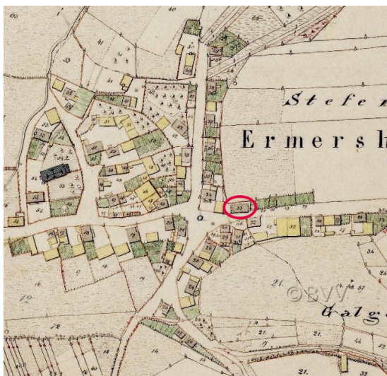
Ermershausen, Uraufnahme 1808-1864 (Ausschnitt). Die Synagoge am westlichen Ortsrand ist im roten Kreis markiert.

Juden sind wohl seit dem Dreißigjährigen Krieg in Ermershausen ansässig und vor 1648 erstmals nachweisbar. Vermutlich siedelten die auf Schloss Birkenfeld ansässigen Ritter von Hutten im Dorf Schutzjuden an, um die Wirtschaft in dem entvölkerten Ort zu fördern. Urkundlich sind 1680 Renovierungsarbeiten an einem nicht näher bestimmbar jüdischen Haus belegt. Der "Judenberg" südöstlich von Ermershausen war ein alter Flurname, der vielleicht auf jüdischen Grundbesitz oder eine abgegangene Begräbnisstätte hinwies.