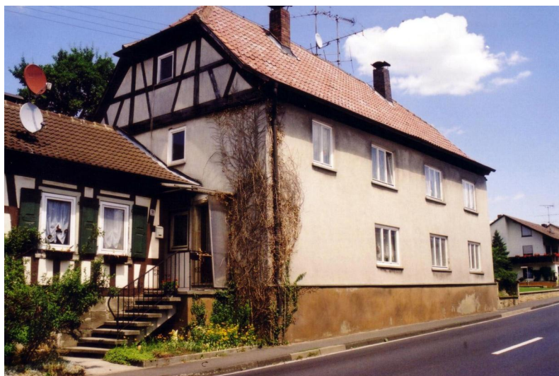
Gebäude der ehemaligen Synagoge in Ermershausen. Auf der linken Seite der Anbau von 1866 für die Religionsschule. Das Gebäude wurde 1957 zu einem Wohnhaus umgebaut (Aufnahme 2009)

Der Zeitpunkt, wann die jüdischen Männer in Ermershausen den Minjan von zehn religionsmündigen Männern erreichten und damit eine feste Gemeinde bildeten, ist unbekannt. Eine Synagoge, die vermutlich mit dem 1849 im Urkataster aufgeführten Gotteshaus identisch ist, wurde erstmals 1766 aktenmäßig erwähnt. Der zweigeschossige, von einem Halbwalmdach abgeschlossene Kernbau wurde auf einem rund 16 Meter langen und acht Meter breitem Grundriss an der Hauptstraße errichtet und stand zur Erbauungszeit am östlichen Ortsrand. Der Plan zeigt sogar eine Toranische, die noch in der mittelalterlichen aschkenasischen Bautradition an der östlichen Außenmauer vorkragte.