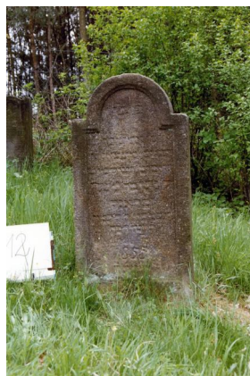
Jüdischer Friedhof Untermerzbach.