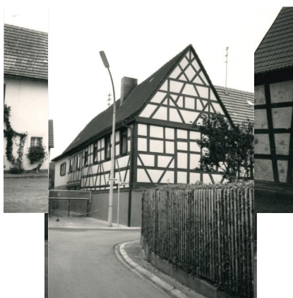
Außenansicht des Gebäudes der ehemaligen Synagoge in Untermerzbach, Judenhof 1 (Aufnahme 1987).