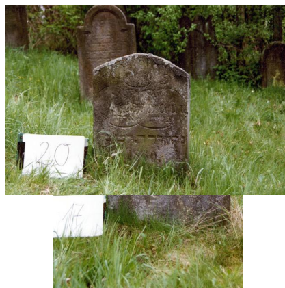
Jüdischer Friedhof Untermerzbach.