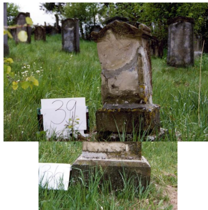
Jüdischer Friedhof Untermerzbach.