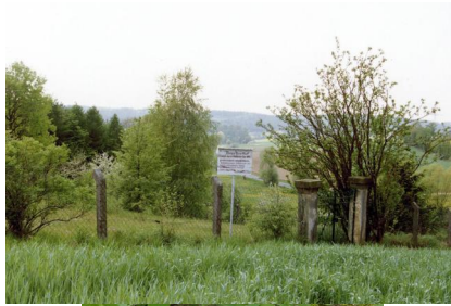
Jüdischer Friedhof Untermerzbach.