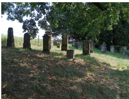
Der jüdische Friedhof Untermerzbach (Aufnahme 2022).