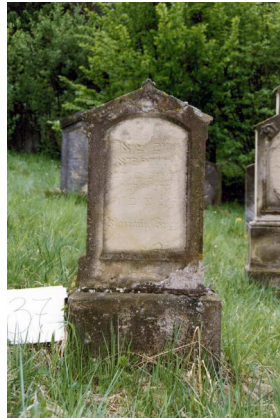
Jüdischer Friedhof Untermerzbach.