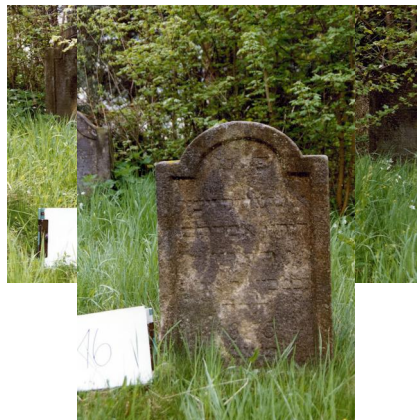
Jüdischer Friedhof Untermerzbach.