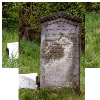
Jüdischer Friedhof Untermerzbach.