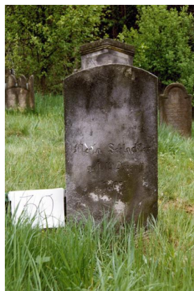
Jüdischer Friedhof Untermerzbach.