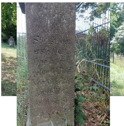
Der jüdische Friedhof Untermerzbach (Aufnahme 2022).