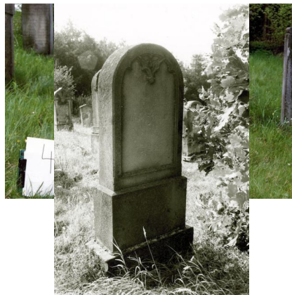
Jüdischer Friedhof Untermerzbach.