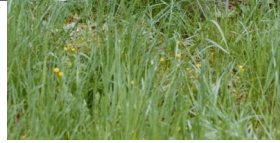
Jüdischer Friedhof Untermerzbach.