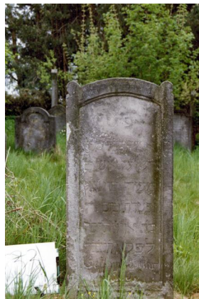
Jüdischer Friedhof Untermerzbach.