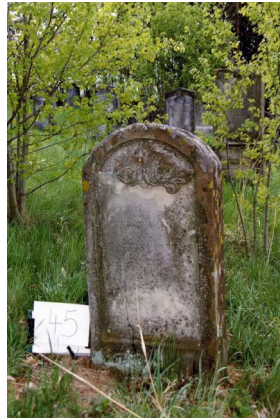
Jüdischer Friedhof Untermerzbach.