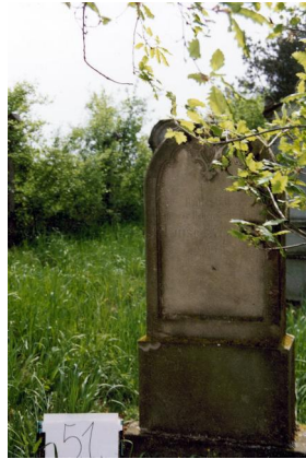
Jüdischer Friedhof Untermerzbach.