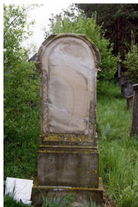
Jüdischer Friedhof Untermerzbach.