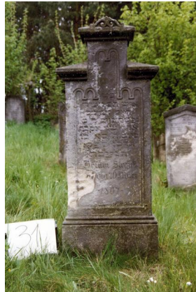
Jüdischer Friedhof Untermerzbach.