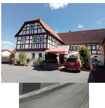
Außenansicht des Gebäudes der ehemaligen Synagoge in Untermerzbach, Judenhof 1 (Aufnahme 1987).