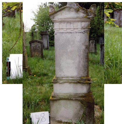
Jüdischer Friedhof Untermerzbach.