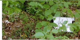
Jüdischer Friedhof Untermerzbach.