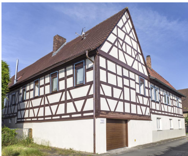
Ehemalige Synagoge, zweigeschossiges und giebelständiges Fachwerkhaus mit Halbwalmdach und hölzernem "Synagogenhimmel", um 1800.

Von einer Synagoge in Untermerzbach ist seit dem 18. Jahrhundert auszugehen. Der Ort war 1718 Rabbinatssitz. Chaim ben Mosche war Rabbiner für die Bezirke Grabfeld und Würzburg. Über Standort und Aussehen des Gebäudes gibt es keine Aussagen. Da allerdings der frühe jüdische Wohnbereich im Areal "Judenhof" zu vermuten ist, könnte sich die Synagoge im 18. Jahrhundert ebenfalls hier befunden haben. Das Geographische Statistisch-Topographische Lexikon von Franken vermerkte 1801: "Die Juden haben hier auch eine Schule". Die Historisch-topographische Beschreibung des Kaiserlichen Hochstifts und Fürstenthums Bamberg notierte für 1801 für den Ort, es gäbe "elf Tropfhäuser, worunter sechs Judenhäuser sind, welche auch eine Synagoge haben".