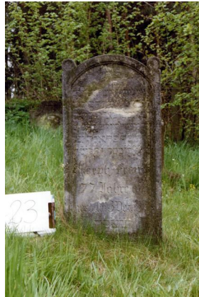
Jüdischer Friedhof Untermerzbach.