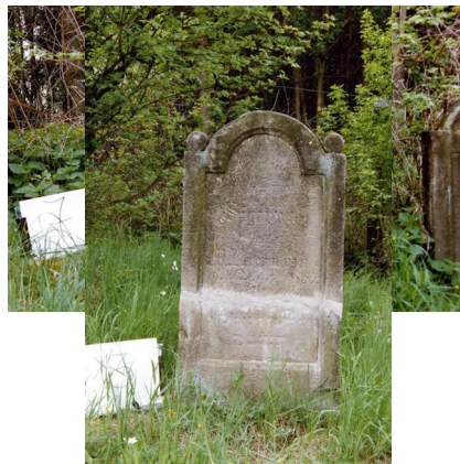
Jüdischer Friedhof Untermerzbach.