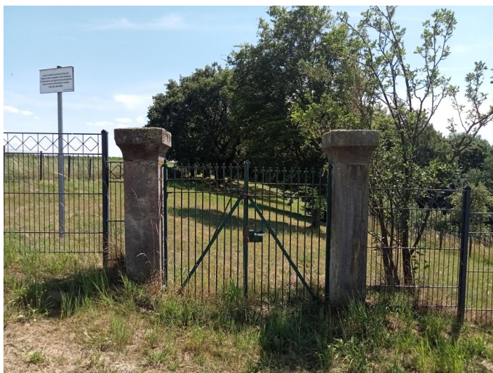
Der jüdische Friedhof Untermerzbach (Aufnahme 2022).

Der jüdische Friedhof Untermerzbach liegt an einem Berghang südwestlich des Ortes an der Straße nach Bamberg. Er umfasst eine Fläche von etwa 1500 qm und wurde 1841 angelegt.