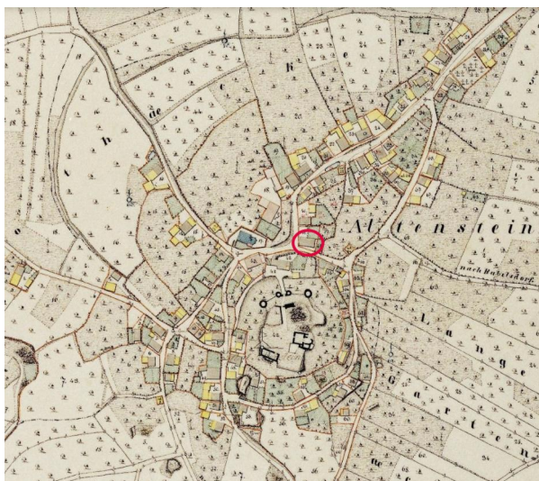
Altenstein, Uraufnahme 1808-1864 (Ausschnitt). Die Synagoge, heute Standort der evangelischen Kirche, ist im roten Kreis markiert.