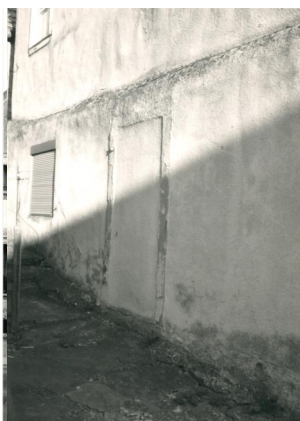
Ehemaliges Synagogengebäude nach einem ersten Umbau zu einem Wohngebäude Anfang des 20. Jahrhunderts (Aufnahme um 1990).

Ob tatsächlich bereits im 17. Jahrhundert eine Synagoge in Knetzgau existierte, ist nur zu vermuten. Da die jüdische Gemeinde seit Ende des 18. Jahrhundert etwa 25 bis 30 Mitglieder umfasste, ist spätestens zu dieser Zeit ein Betsaal oder ein Synagogengebäude anzunehmen. Das Synagogengebäude (Westheimer Straße 3) wird in die Zeit um 1800 datiert. Der zweigeschossige und giebelständige Satteldachbau mit einem rückwärtigem Walm. Im Gebäude sind auch die Reste einer Kellermikwe erhalten. Wahrscheinlich im Zuge der Auflösung der Knetzgauer Gemeinde in der zweiten Hälfte des 19. Jahrhundert wurde das Gebäude verkauft und in ein Wohnhaus umgebaut. Es ist im DenkmalAtlas erfasst.