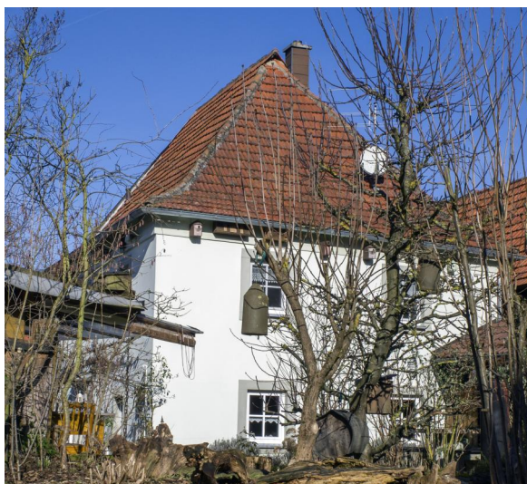
Ehemalige Synagoge, jetzt Wohnhaus, zweigeschossiger und giebelständiger Satteldachbau mit rückwärtigem Walm, mit Mikwe, um 1800 (Aufnahme 2022).

Ob tatsächlich bereits im 17. Jahrhundert eine Synagoge in Knetzgau existierte, ist nur zu vermuten. Da die jüdische Gemeinde seit Ende des 18. Jahrhundert etwa 25 bis 30 Mitglieder umfasste, ist spätestens zu dieser Zeit ein Betsaal oder ein Synagogengebäude anzunehmen. Das Synagogengebäude (Westheimer Straße 3) wird in die Zeit um 1800 datiert. Der zweigeschossige und giebelständige Satteldachbau mit einem rückwärtigem Walm. Im Gebäude sind auch die Reste einer Kellermikwe erhalten. Wahrscheinlich im Zuge der Auflösung der Knetzgauer Gemeinde in der zweiten Hälfte des 19. Jahrhundert wurde das Gebäude verkauft und in ein Wohnhaus umgebaut. Es ist im DenkmalAtlas erfasst.