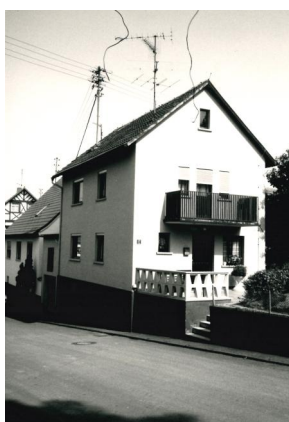
Während des Novemberpogrom wurde die Synagoge schwer beschädigt. 1978 wurde die Bauruine abgebrochen und auf den Grundmauern ein Wohngebäude errichtet (Aufnahme um 1990).