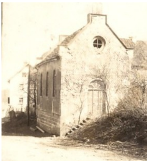
Synagoge Eichenhausen, 1925.