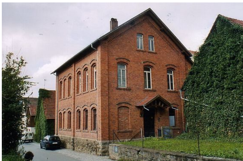
Das nach 1945 zu einem Wohnhaus umgebaute Gebäude der Synagoge in Willmars.