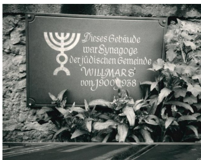
Das zu einem Wohnhaus umgebaute Gebäude der ehemaligen Synagoge Willmars um 1987.