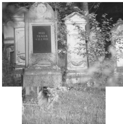
Jüdischer Friedhof Unsleben.