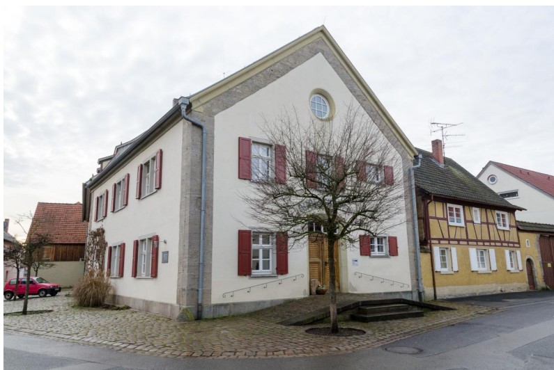
Ehemalige Synagoge, zweigeschossiges Satteldachgebäude mit Hausteingliederung, 1851-55, in den 1980er Jahren "Haus der Bäuerin", dann später Teil der "Dorfscheuer".

Vermutlich in den ersten Jahrzehnten des 18. Jahrhunderts wurde außerhalb des Schlosshofs am Rand des Dorfs die erste Unlebener Synagoge eingerichtet. Die barocke Synagoge wurde als eingeschossiger, rund elf Meter langer und rund fünf Meter breiter Fachwerkbau errichtet. Eine Beschwerde des katholischen Ortspfarrers berichtet wahrscheinlich über den festlichen Umzug, in dem die Torarollen aus dem Betsaal im Schloss in die neue Synagoge übertragen wurden. 1753 wurde das wahrscheinlich kleine Bethaus renoviert und 1757 gegen den Widerstand des katholischen Dorfpfarrers und der Verwaltung des Hochstifts vergrößert. Seit dieser Zeit erschloss eine Außentreppe die Frauenempore.