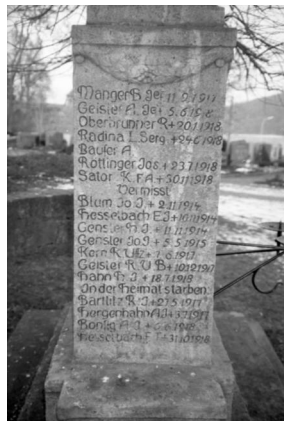
Unsleben, Kriegerdenkmal für die Gefallenen des Ersten Weltkrieges (Aufnahme Israel Schwierz, 1996). Copyright BayHStA, BS N 80 80/22-25A