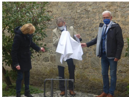
Einweihung der Koffer-Skulptur zum Gedenken an die deportierten Opfern der Schoa (2020)Ein Gegenstück

des Denkmals erweitert den DenkOrt Deportationen in Würzburg.