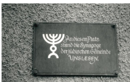
Tafel zur Erinnerung an die Synagoge (Aufnahme 1987).

Die beiden Steintafeln mit den Zehn Geboten befanden sich ursprünglich an der Außenwand der Synagoge Unsleben. Der Gedenkstein mit den beiden Tafeln wurde 1975 auf dem jüdischen Friedhof Unsleben errichtet (Aufnahme 2014).