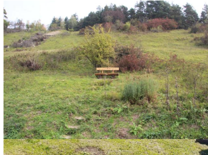
Jüdischer Friedhof Unsleben, 2021.

"Steinerne Zeugnisse jüdischen Lebens in Bayern" zur Verfügung gestellt. Dafür gilt ihm unser großer Dank. Diese Fotografien stellen gerade im Hinblick auf die in vielen Fällen in den letzten 25 Jahren sehr rasch fortgeschrittene Verwitterung der Grabsteine eine wertvolle Quelle dar.