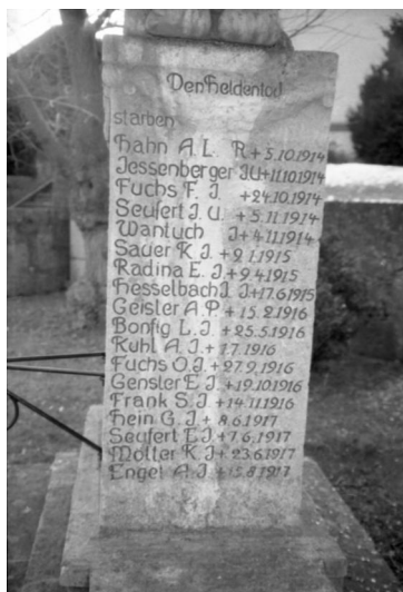
Unsleben, Kriegerdenkmal für die Gefallenen des Ersten Weltkrieges (Aufnahme Israel Schwierz, 1996). Copyright BayHStA, BS N 80 80/22-20A

Die Gedenkstätte für die Gefallenen der Kriege 1870/71, 1914/18 und 1939/45 von Unsleben befindet sich auf dem Kirchplatz. Unter der Widmung 1914 – 1918 Die dankbare Gemeinde Unsleben ihren Gefallenen Söhnen / Sie waren bereit für Gesetz und Vaterland zu sterben / Ehre ihrem Andenken! sind an den Seiten auch die folgenden jüdischen Soldaten aufgeführt: