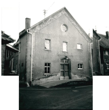
Außenansicht des Gebäudes der ehemaligen Synagoge Unsleben; zur Zeit der Aufnahme 1987 als "Haus der Bäuerin" genutzt.