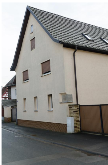
Gebäude mit einer Mikve aus dem 19. Jahrhundert.

Juden sind in Unsleben erstmals 1545 im Rahmen einer Steuerveranlagung nachweisbar. 1571, rund 25 Jahre später, wohnten zwei jüdische Familien im Dorf. 1690 wurden zwei Juden von den Herren von Speßhardt, den Bewohnern des Unslebener Wasserschlosserschlusses, aufgenommen. 1731 lebten auf dem Gutshof bereits elf jüdische Familien mit 26 Personen, die zusammen nur über ein geringes Vermögen von 468 Gulden verfügten. Nachdem einige jüdische Familien aus dem Schlosshof in das Dorf umgezogen waren, beschwerte sich der katholische Dorfpfarrer bei der Würzburger Regierung. Daraufhin verwies der Dorfherr 1737 darauf, dass die wohlhabenden Unslebener Juden vor allem Viehhandel in den angrenzenden sächsischen Territorien betrieben.