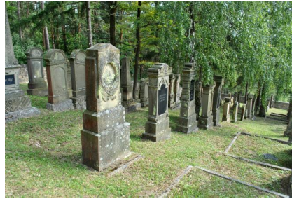
Jüdischer Friedhof Unsleben, 2014