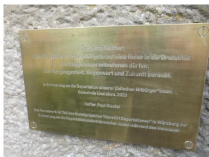
Einweihung der Koffer-Skulptur zum Gedenken an die deportierten Opfern der Schoa (2020) Ein Gegenstück