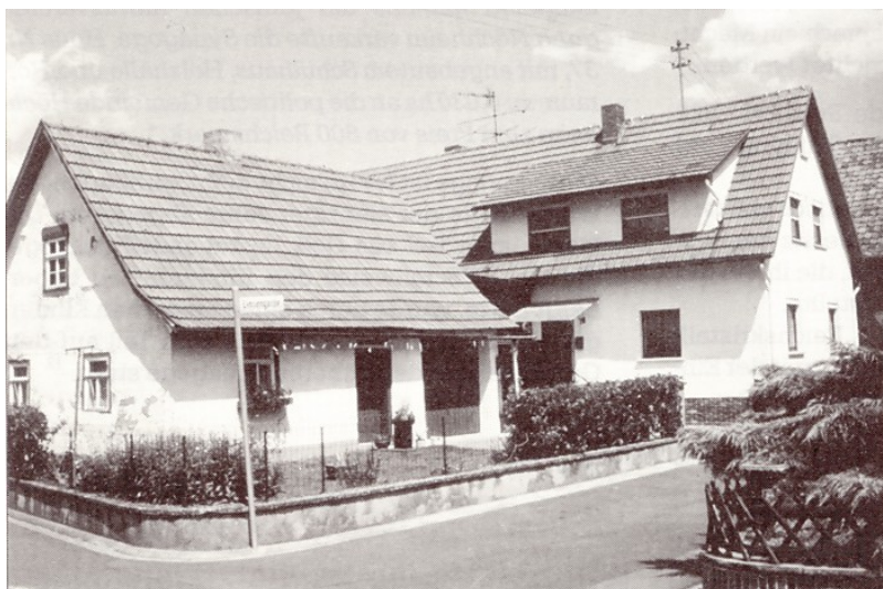
Das zu einem Wohnhaus umgebaute ehemalige Synagogengebäude, 1990.

Vermutlich existierte bereits Ende des 18. Jahrhunderts in Trappstadt ein jüdischer Betsaal. Nachdem um 1800 die Zahl der Mitglieder der jüdischen Gemeinde in Trappstadt gewachsen war, entschloss sich die jüdische Kultusgemeinde, eine Synagoge zu errichten, und erwarb 1811 ein mit zwei Häusern bebautes Anwesen. Die Finanzierung des Neubaus belastete die finanzschwache Gemeinde, so dass diese am 18. Mai 1812 bei der in Röhild ansässigen Sächsisch-Meiningen'schen Regierung beantragte, die Steuern und Abgaben um die Hälfte zu senken.