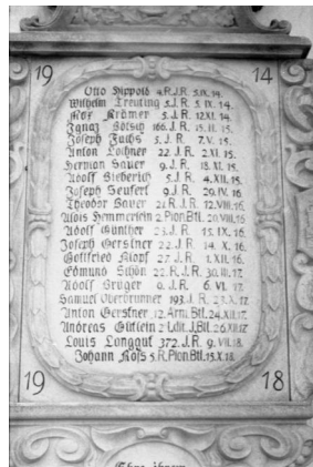
Trappstadt, kath. Pfarrkirche St. Burkhard Gedenktafel mit den Namen von Louis Langguth und Samuel Oberbrunner (Aufnahme Israel Schwierz, 1996). Copyright BayHStA, BS N 80 80/16-18A