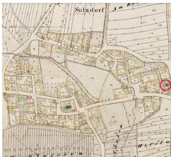
Sulzdorf a.d. Lederhecke, Uraufnahme 1808-1864 (Ausschnitt). Das gemeindezentrum am westlichen Ortsrand ist im roten Kreis markiert.