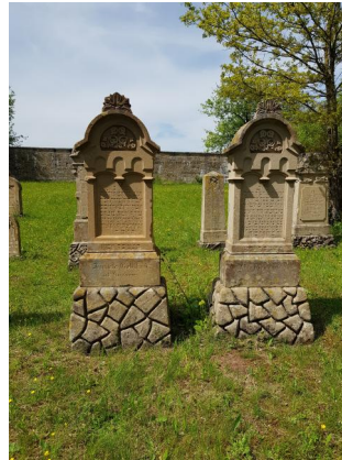
Jüdischer Friedhof Sulzdorf a.d. Lederhecke, 2021.