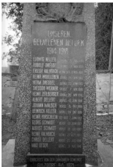
Sulzdorf an der Lederhecke, Kriegerdenkmal vor dem kommunalen Friedhof (Aufnahme Israel Schwierz, 1996). Copyright BayHStA, BS N 80 80/18-08

In Sulzdorf an der Lederhecke gibt es rechts vor dem Friedhof in einer kleinen Grünanlage ein dreiteiliges Kriegerdenkmal beider Weltkriege. Unter der Überschrift: UNSEREN GEFALLENEN HELDEN 1914 – 1918 sind im mittleren Denkmal die Namen der Bürger aus Sulzdorf a.d.L. aufgeführt, die nicht mehr aus dem Krieg zurückgekehrt sind, darunter auch der des jüdischen Soldaten: