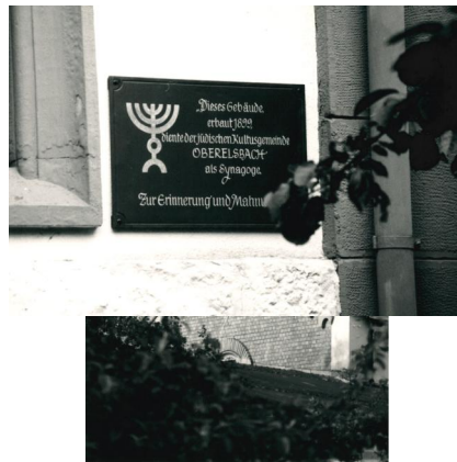
Ehemaliges Synagogengebäude Oberelsbach, 1987.