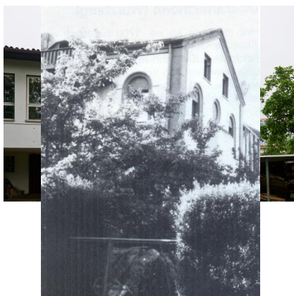
Ehemalige Synagoge, Satteldachbau, Ziegel mit Sandsteingliederungen, Rundbogenfenstern und Toranische, Gesetzestafeln als Giebelbekrönung, erbaut 1898, eingeweiht 1899; lange Zeit Nutzung als Wohnhaus (Aufnahme 2021).