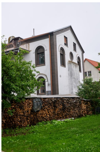
Ehemalige Synagoge, Satteldachbau, Ziegel mit Sandsteingliederungen, Rundbogenfenstern und Toranische, Gesetzestafeln als Giebelbekrönung, erbaut 1898, eingeweiht 1899; lange Zeit Nutzung als Wohnhaus (Aufnahme 2021).

Nachdem 1808 die großherzogliche Regierung die Errichtung einer Synagoge in Oberelsbach genehmigt hatte wurde diese wohl 1810 fertiggestellt. Der auf rechteckigem Grundriss errichtete Bau stand im Süden des Marktes und war über die Höfe der benachbarten jüdischen Anwesen erreichbar. Da der Großbrand 1895 auch die Synagoge zerstört hatte, erwarb die Kultusgemeinde zusätzlichen Grund, um eine größere Distanz zum Nachbargrundstück zu erreichen und die Synagoge nach Osten ausrichten zu können. Nachdem am 18. Februar 1898 die Baugenehmigung erteilt worden war, konnte der bereits am 15. Oktober desselben Jahrs abgeschlossene Neubau am 18. August 1899 feierlich eingeweiht werden.