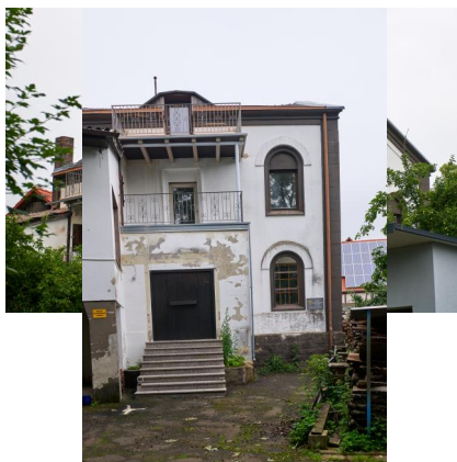
Ehemalige Synagoge, Satteldachbau, Ziegel mit Sandsteingliederungen, Rundbogenfenstern und Toranische, Gesetzestafeln als Giebelbekrönung, erbaut 1898, eingeweiht 1899; lange Zeit Nutzung als Wohnhaus (Aufnahme 2021).

1954 ließ eine Privatperson die ehemalige Synagoge zu einem Wohnhaus und einem Fotoatelier umbauen und dabei eine Betondecke in den ehemaligen Betsaal einziehen. Während die Außenmauern der Synagoge intakt blieben, sind heute die zwei westlichen Fensterachsen der südlichen Längsseite durch einen Anbau und Balkone verdeckt. Erhalten sind auch das dreiteilige Hauptportal, der Thoraerker mit dem Misrachfenster, die den Thoraerker links und rechts flankierenden Rundbogenfenster und die Gesetzestafeln auf der Spitze des westlichen Giebels. An der Südseite der ehemaligen Synagoge erinnert eine Gedenktafel an die vormalige Nutzung des Gebäudes.