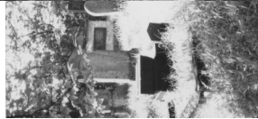
Jüdischer Friedhof Bad Neustadt.