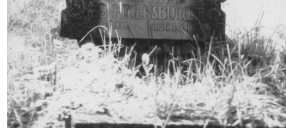
Jüdischer Friedhof Bad Neustadt.