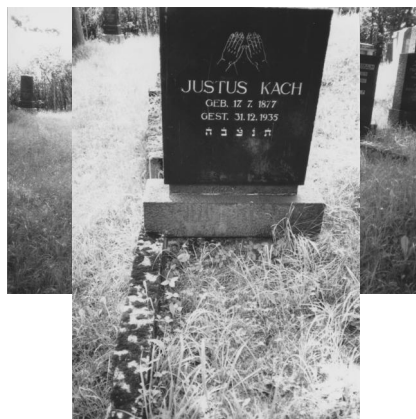
Jüdischer Friedhof Bad Neustadt.