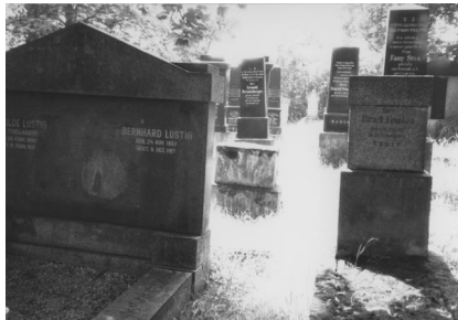
Jüdischer Friedhof Bad Neustadt.