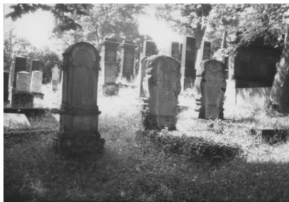
Jüdischer Friedhof Bad Neustadt.