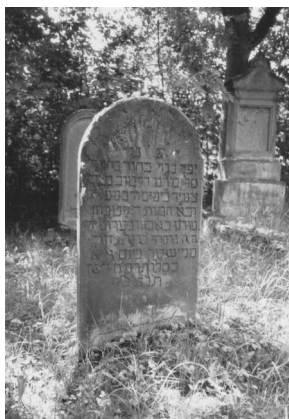
Jüdischer Friedhof Bad Neustadt.