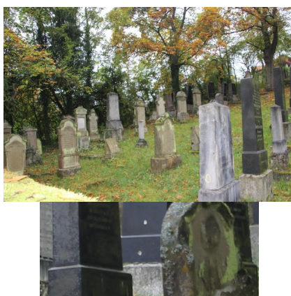
Jüdischer Friedhof in Bad Neustadt/Saale, 2014.