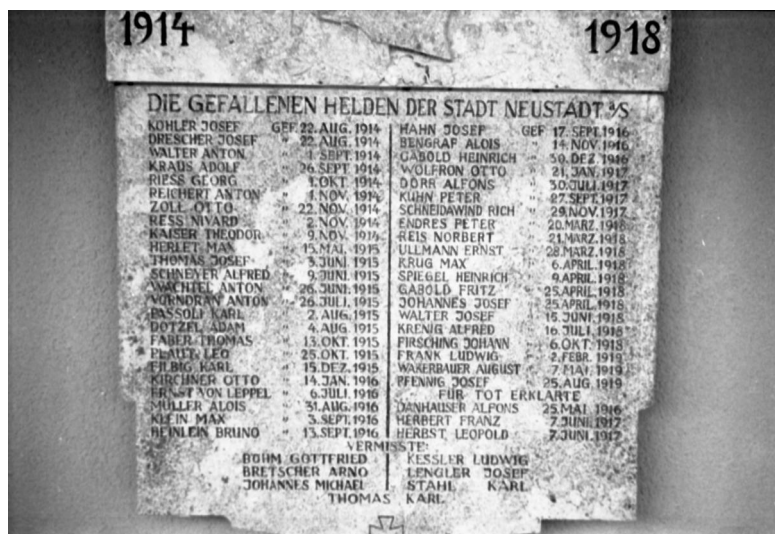
Bad Neustadt an der Saale, Gedenktafel auf dem Stadtfriedhof (Aufnahme Israel Schwierz, 1996). Copyright BayHStA, BS N 80 80/22-14A

In Bad Neustadt an der Saale gibt es eine kommunale Gedenktafel für die Gefallenen des Ersten Weltkrieges an der Aussegnungshalle des Stadtfriedhofes (Eingang Goethe-Straße), außerdem erinnern einige Grabsteine auf dem jüdischen Friedhof an die gefallenen Gemeindemitglieder aus Bad Neustadt.