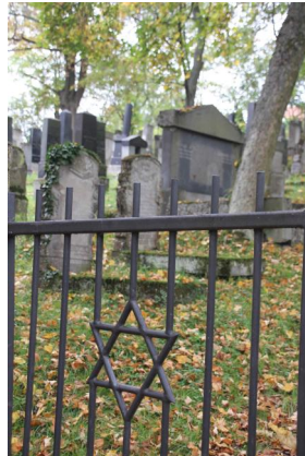
Jüdischer Friedhof in Bad Neustadt/Saale, 2014.