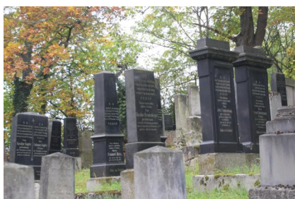
Jüdischer Friedhof in Bad Neustadt/Saale, 2014.