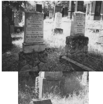
Jüdischer Friedhof in Bad Neustadt/Saale, 2014.