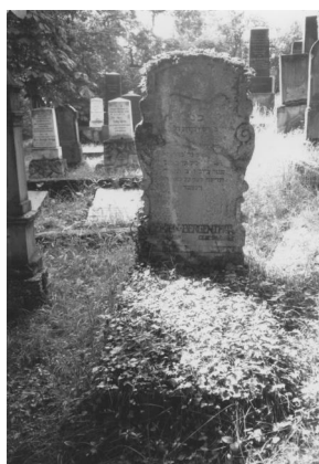
Jüdischer Friedhof Bad Neustadt.