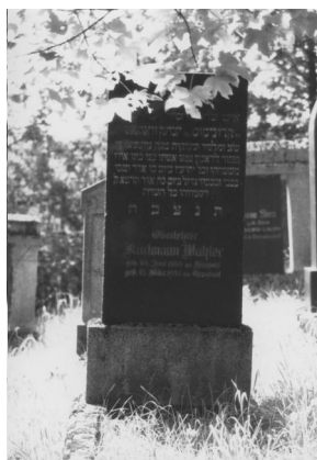
Jüdischer Friedhof Bad Neustadt.