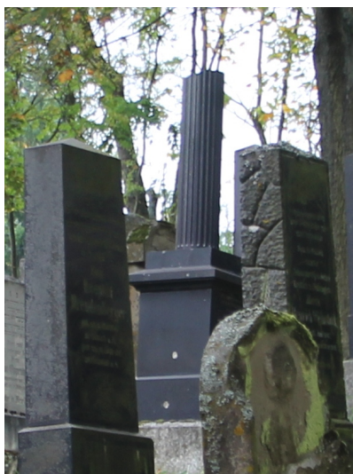
Jüdischer Friedhof in Bad Neustadt/Saale, 2014.

Der jüdische Friedhof von Bad Neustadt liegt innerhalb der Stadt an einem Hang nahe der Mozartstraße (Adresse: Jahnstraße 25). Er hat eine Größe von über 3000 qm und wurde 1888/89 angelegt. Der Friedhof war bis 1942 Begräbnisstätte.