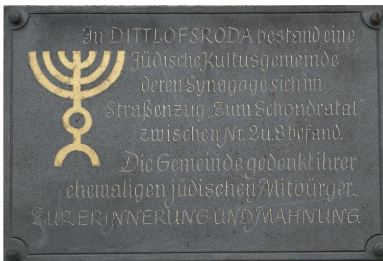
Dittlofsroda, Gedenktafel für die jüdische Gemeinde am örtlichen Gemeindehaus (Aufnahme 2019).

Ende des 17. Jahrhunderts wurde im Zins- und Gültbuch der Herren von Thüngen erstmals ein jüdischer Hausbesitzer („Feußlein jud“) in Dittlofsroda erwähnt. Dieses Haus, über dessen Standort man keine Informationen hat, befand sich zwischen 1695 und 1722 im Eigentum von "Maises Jud". 1736 leben bereits sieben Schutzjuden des Freiherrn von Thüngen in dem Bauerndorf. Man darf annehmen, dass sich spätestens zu diesem Zeitpunkt eine jüdische Gemeinde gebildet hatte. Rund vierzig Jahre später (1787) waren laut Zins- und Gültbuch fünf Häuser in jüdischem Besitz. Fast alle lagen in kleinen Parzellen dicht nebeneinander an der Straße am westlichen Ortsrand (heute: Zum Schondratal). 1795 überließen die Brüder Hofmann (Haus-Nr. 35) der Kultusgemeinde den rückwärtigen Teil ihres Grundstücks, auf dem ein Jahr später eine Fachwerksynagoge (Haus-Nr. 39, Plan-Nr. 73) errichtet wurde. 1763 wird erstmals ein jüdischer Schulmeister in Dittlofsroda erwähnt. Mit der jüdischen Gemeinde Völkersleier , die vier Kilometer entfernt lag, teilte man sich den Rabbiner und Schächter. Die meisten der hier ansässigen jüdischen Familien lebten vom mobilen Kleinhandel (Hausieren) und Viehhandel. Die Kultusgemeinde beerdigte ihre Toten auf dem jüdischen Friedhof in Pfaffenhausen bei Hammelburg, der rund drei Wegstunden entfernt lag.