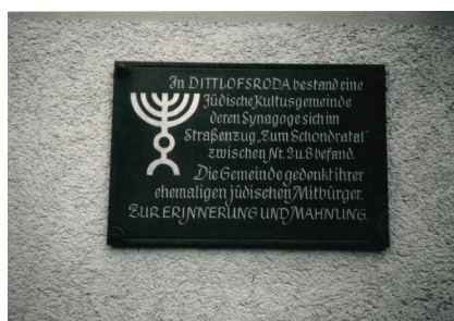
Eine Gedenktafel am Gemeindehaus erinnert an das Schicksal der jüdischen Mitbürger von Dittlofsroda (Aufnahme um 1990).