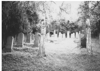
Maßbach, Doppelgrab der Familie Katzenberger auf dem jüdischen Friedhof (Aufnahme 2008).