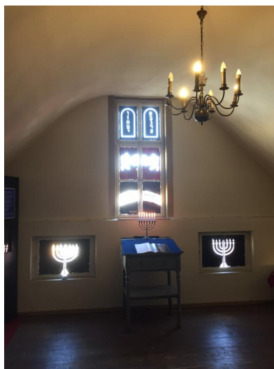
Maßbach, Installation in der rekonstruierten Synagoge - Gedenkstätte und Museum (Aufnahme 2016).