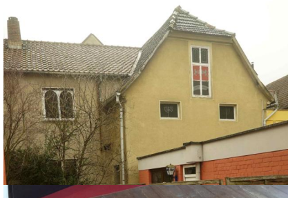
Maßbach, Ausstellung in der Frauenempore der rekonstruierten Synagoge - Gedenkstätte und Museum (Aufnahme 2012).