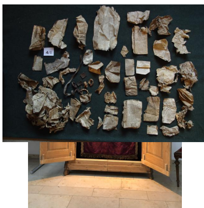
Maßbach, Toravorhang der ehem. Synagoge (Aufnahme 2023).