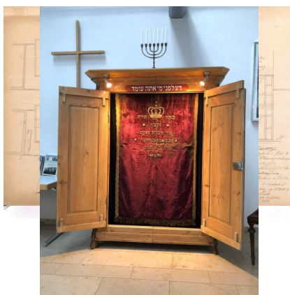
Rekonstruktionsskizze der Synagoge Maßbach mit Blick auf den Toraschrein, 2016.