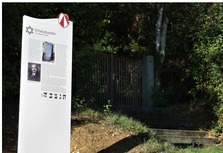
Maßbach, Eingang zum jüdischen Friedhof mit kommunaler Infotafel (Aufnahme 2008).

Der jüdische Friedhof liegt an einem steilen Berghang in der Flur „Steinerloh“ nordwestlich von Maßbach. Er hat eine Größe von fast 400 qm und ist 1902/1903 angelegt worden. Es sind noch 41 Grabsteine erhalten.