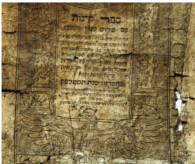
Maßbach, Genisa-Fund: Fragment eines Druckwerks aus Prag 1709 (Aufnahme 2016).

Juden aus Maßbach sind erstmals im Jahr 1504 in einem Bericht des Fuldaer Fürststabs Johann von Henneberg-Schleusingen erwähnt. Im 1555 ließ Graf Wilhelm IV. von Henneberg-Schleusingen (1478-1559) alle Juden aus seinen Besitzungen, zu denen auch Maßbach gehörte, ausweisen. Trotzdem lebte nachweislich ein Schutzjude weiterhin im Maßbacher Schloss. Später wurde das Ansiedelungsverbot wieder aufgehoben, denn aus einem 1601 geschlossenen Vertrag kann man entnehmen, dass Juden in Maßbach Vieh hielten und vermutlich auch damit handelten. Ein Lehenbuch, das zwischen 1630 und 1643 angelegt wurde, verzeichnet drei Häuser bzw. Hausteile im Ort, die mehrere Generationen lang im Besitz von jüdischen Familien waren.