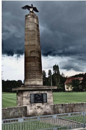
Maßbach, Kriegerdenkmal des Ersten Weltkriegs (Aufnahme 2014).

In Maßbach existiert ein Kriegerdenkmal für die Gefallenen des Ersten Weltkrieges in der Neuen Straße beim alten Sportplatz. Unter einer hohen Säule mit einem bekrönenden Reichsadler befindet sich auf der Vorderseite eine Metallplatte mit einem Relief in der Mitte und den Namen der Gefallenen rechts und links davon, unter ihnen zu den Jahreszahlen zugehörig die Namen der beiden jüdischen deutschen Soldaten