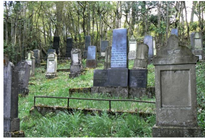
Maßbach, jüdischer Friedhof (Aufnahme 2008).