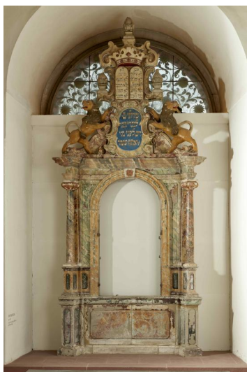
Tora-Schrein (Aron ha-Kodesch), Sandstein, gefasst, Unterfranken, 1768, Leihgabe der Stadt Würzburg im Museum für Franken in Würzburg (Inv. Nr. S. 46268). Der Tora-Schrein aus der Synagoge Westheim bei Hammelburg wurde nach Abschluss des Restitutionsverfahrens vom Mainfränkischen Museum erworben.

Bis ins letzte Drittel des 18. Jahrhunderts versammelten sich die Erthal'schen Schutzjuden von Westheim in einem Privathaus zum Gottesdienst, den ein "juden schuhmeister" (1762) leitete. Über diesen einen, oder mehrere frühere Betsäle ist nichts weiter bekannt. Im Sommer 1767 wurde eine Synagoge in der heutigen Kellergasse 7 errichtet, die bis August "unter Dach" stand. Sie überragte durch ein hohes Mansardendach die angrenzende Architektur und weckte dadurch das Missfallen der Obrigkeit. Weil der Bau jedoch auf dem Gelände des reichsritterlichen Freihofs stand, in zweiter Reihe zur späteren Judengasse, waren dem Würzburger Fürstbischof Adam Friedrich von Seinsheim (reg. 1755-1779) die Hände gebunden.