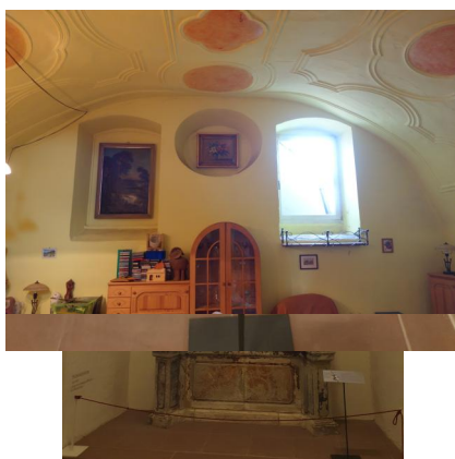
Würzburg, Museum für Franken, Aron ha-Kodesch (Toraschrein) aus der Synagoge Westheim bei Hammelburg (Aufnahme 2023).