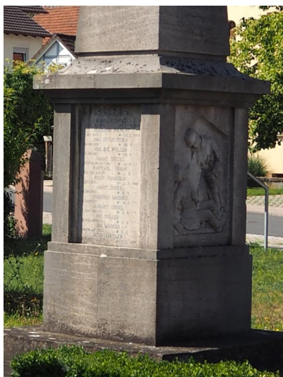
Gedenktafeln am Kriegerdenkmal Westheim (Aufnahme 2019).

In Westheim, heute ein Ortsteil von Hammelburg, gibt es zwischen der kath. Kirche St. Peter und Paul und der Fränkischen Saale eine Gedenkstätte für die Gefallenen beider Weltkriege: Eine Mauer mit einer Gruppe von Kreuzen in der Mitte und tafeln mit den Namen der Kriegstoten. Links steht auf der Tafel für 1914 auch der Namen des jüdischen Gefallenen WILLI HANAUER , und unter VERMISSTE der von WILLI ADLER .