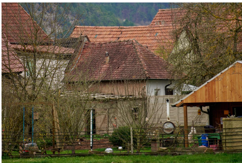
Im Vordergrund Häuschen der ehemaligen Mikwe, Paulstraße 2. Das Gebäude wurde 1913 errichtet und war eine Regenwassermikwe. Das Gebäude musste gemeinsam mit der jüdischen Schule 1937 verkauft werden. Es ist im Bayerischen Denkmal-Atlas verzeichnet.

Um 1500 werden in einem Würzburger Urbar erstmals zwei Juden in Westheim erwähnt, die dem Fürstbischof für ihr Gehöft "gult und zins" zahlten: "Item Lewe jud gibt vier moß weins iii d[enarios] von einer hoffstat zu Westheym" und "item Seylikman jud viii moß weins vi d[enarios] von einer hof stat zu Westheym". Seit dem Jahr 1508 unterstand das Dorf Westheim zwei Landesherrschaften, die Grenze verlief entlang der heutigen Westheimer Straße mitten durch den Ort. Der Osten gehörte der Abtei Fulda, der Westen dem Hochstift Würzburg. Dieses wiederum hatte bereits 1454 auf ihrer Seite dem ministerialen Adelsgeschlecht von Erthal einen Hof mit 20 Morgen Ackerland als erbliches Mannlehen übertragen; das bedeutete, dass dieses Lehen im Mannesstamm vererbt wurde.