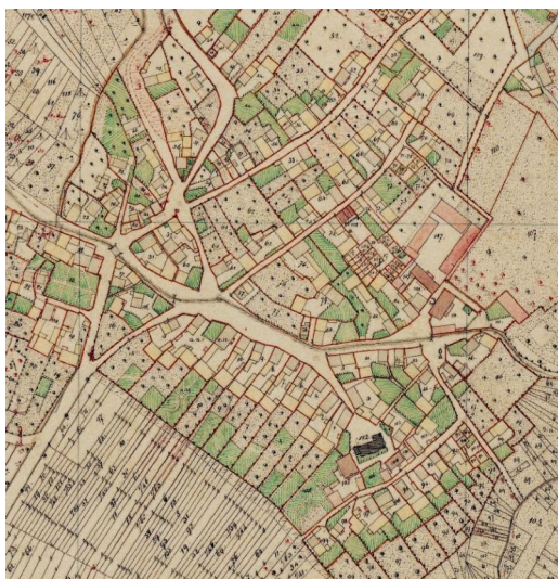
Untererthal, Uraufnahme 1808-1864 (Ausschnitt).