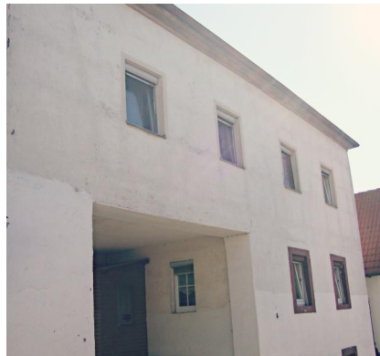
Ehemalige Synagoge, Judengasse 6 (Aufnahme 2012).