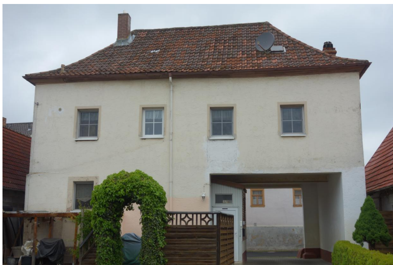
Untererthal, Judengasse 15, Hofseite der ehem. Synagoge (Aufnahme 2019).

Im 17. Jahrhundert versammelten sich die Untererthaler Juden in einem privaten Betsaal. 1737 errichteten sie mit Erlaubnis der Ortsherrschaft eine eigene Synagoge im "Judenhof" (heute Judengasse 6). Dabei handelte es sich um einen bescheidenen, hölzernen Anbau am Haus des Nathan, rechts des Eingangstores zur Erthal'schen Burg in einem zum Gut gehörenden Garten. Weil der Fürstabt von Fulda keine Baugenehmigung erteilt hatte, drangen im Juli 1737 Fuldaer Soldaten "in den Burgplatz ein [...] und [haben] solanes Schul-Bäulein gewaltsamer Weis auf den Grund darnieder gerissen". Die Juden mussten weiterhin ihre Gottesdienste in einer "Stube" feiern.