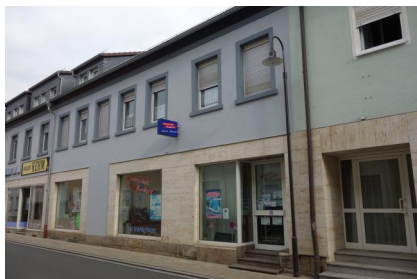
Bad Brückenau, Ludwigsstraße 18-24, von rechts: ehem. Schuhgeschäft Adler, Modegeschäft "Spieri", Kaufladen Grünebaum und Bankgeschäft Zeller (Aufnahme 2018).