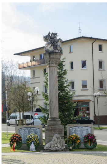
Bad Brückenau, Kriegerdenkmal vor dem Alten Rathaus (Aufnahme 2013).