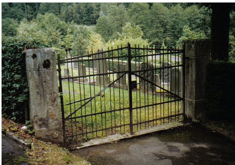
Eingangstor des jüdischen Friedhofs Bad Brückenau.

In Bad Brückenau gibt es zwei jüdische Friedhöfe. Der Ältere wird als Teil des Stadtfriedhofs vermutet und war zwischen ca. 1560 und 1671 belegt. Der neue jüdische Friedhof ist Teil des kommunalen Waldfriedhofs. Er wurde 1923 eingeweiht. Die Gräber sind mit Steinplatten belegt.