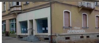
Bad Brückenau, Ludwigstraße 4, 1898 erbautes Wohnhaus der Familie Schuster (Aufnahme 2018).