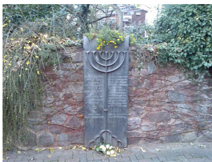
Denkmal zur Erinnerung an die ehemalige Synagoge Alzenau