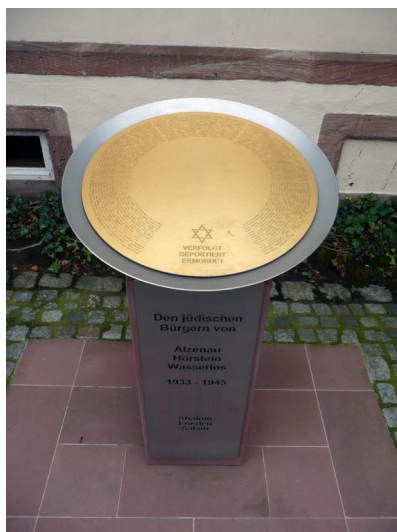
Gedenkskulptur neben dem Eingang zum Rathaus (Aufnahme 2014).

Als erster jüdischer Einwohner von Alzenau ist im Jahr 1688 ein Mann namens "Davit Jud" nachgewiesen. 1707 erscheinen in der Einwohnerstatistik von Alzenau eine jüdische Familie und in Wasserlos vier jüdische Haushalte. Auch 25 Jahre später nennt ein Güterverzeichnis in Alzenau nur drei und in Wasserlos vier israelitische Familien. In den 1770er Jahren war die jüdische Gemeinde dann auf rund 40 Mitglieder angewachsen. Die Kultusgemeinde Alzenau-Wasserlos gehörte bis 1803 zum Landesrabbinat Aschaffenburg . Da Alzenau nach dem Reichsdeputationshauptschluss dem Großherzogtum Hessen-Darmstadt eingegliedert wurde, teilte man die örtliche Judenschaft vorerst dem Hanauer Rabbinat zu.