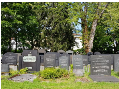
Jüdischer Altstadtfriedhof Aschaffenburg, 2021.