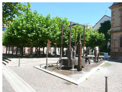
Aschaffenburg, Treibgasse 20, kommunale Informationstafeln zur Synagoge und dem Rabinatsgebäude (Museum Jüdischer Geschichte & Kultur) als "Orte der Erinnerung" (Aufnahme 2025).