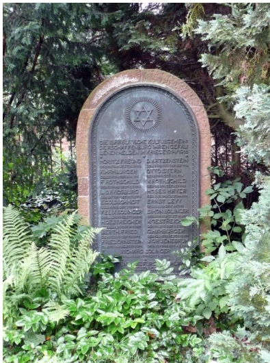
Ehrentafel von 1923/24, heute auf dem jüdischen Altstadtfriedhof (Aufnahme 2012).

Auf der jüdischen Abteilung des Aschaffener Altstadtfriedhofes in der Stadtmitte ist rechts vom Eingang ein Denkmal für die gefallenen jüdischen deutschen Soldaten mit der folgenden Inschrift unter einem Davidstern zu finden (das Denkmal befand sich ursprünglich in der 1938 zerstörten Synagoge der Israel. Kultusgemeinde Aschaffenburg, s.A.).