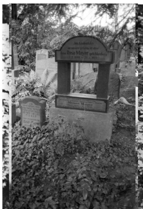
Aschaffenburg, Kriegerdenkmal der Kultusgemeinde Aschaffenburg auf dem jüdischen Friedhof (Aufnahme Israel Schwier, 1996). Copyright BayHStA, BS N 80 80/117-147

schwer verwundet im Weltkrieg, beerdigt zu Ceude (Frankreich).