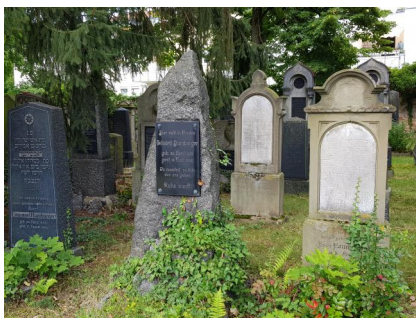
Altstadtfriedhof, Gedenktafel für die Torarollen (Aufnahme 2011).