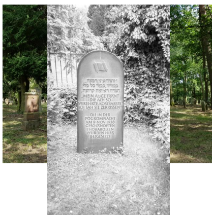
Aschaffenburg, jüdischer Friedhof "Am Erbig" (Schweinheim), 2021.

Schändungen: Schändungen während der NS-Zeit. 1985 wurden 42 Grabsteine aus dem Boden gerissen, mehrere stark beschädigt, viele mit weißer Ölfarbe beschmiert.